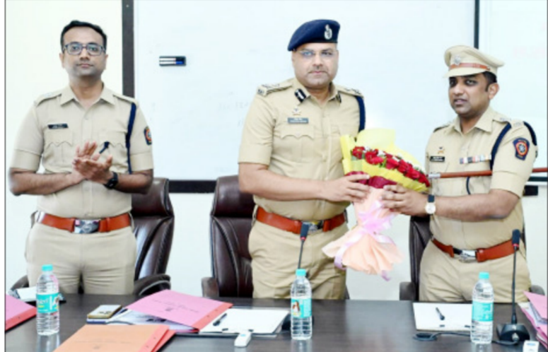
अमलदार आणि मंत्राज्येीन कर्मचारी यांचे सैनिक सम्मेलन घेऊन अडी-अडचणी बाबत माहिती घेऊन अखत्यारीत

करण्यात आलेले ‘‘सुरक्षा मंत्र आधुनिक जगात एक पाऊल पुढे’’ या पुस्तकाचे विमोचन केले. जालना पोलीस दलाच्या या नाविन्यपूर्ण कल्पनेचा मा. विशेष पोलीस महानिरीक्षक यांनी कौतुक केले. पोलीस अधीक्षक कार्यालयातील सर्व शाखाना भेट देऊन त्यांचे कामकाजाचा आढावा घेतला, लोकोपकारी व तत्परतेने काम करण्याबाबत मार्गदर्शन केले. कार्यालयीन कामकाजामध्ये नियमित सुधारणा करणे मला अपेक्षित आहे अशा सूचना देण्यात आल्या. दि. ०७ मार्च रोजी पोलीस मुख्यालय येथे वार्षिक निरीक्षण अनुषंगाने पर्यटचे निरीक्षण केले. दंगा काबू नियंत्रण, बॉम्ब शोधक व नाशक, रवान पथक, अंगुलीमुद्रा, मोबाईल फॉरन्सिक व्हॅन व दहशतवादी-आतंकवादी यांना जलदयातीने ताब्यात घेणे या सर्व बाबींचे प्रात्यक्षिकांचे निरीक्षण केले. पोलीस अधिकारी व