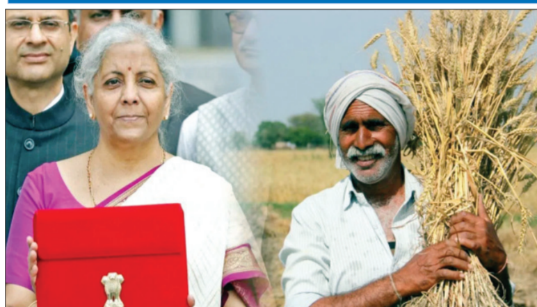
करण्यात आली आहे. डाळीचे उत्पादन वाढवण्यासाठी आत्मनिर्भरता मिशन राबवण्यात येईल. तूर, उडीद आणि मसूर डाळीच्या