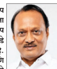
पान २ वर

उपमुख्यमंत्री अजित पवार म्हणाले की, मार्चच्या पहिल्या आठवड्यात किंवा दुसऱ्या आठवड्यात राज्याचा अर्थसंकल्प सादर करणार आहे. माझा शेतकरी वर्ग आणि सर्वसामान्य नागरिक यांचा विचार करून अर्थसंकल्प मांडणार आहे. तसेच लाडक्या बहिणींसाठी या अर्थसंकल्पात विचार केला