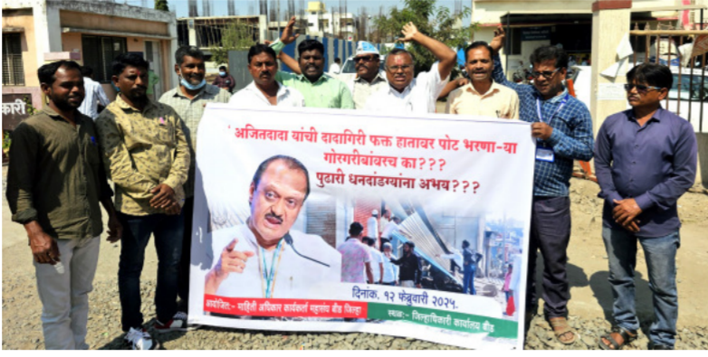
त्याच बरोबर बिंदुसरा नदीपात्रात फ्लड झोन बांधकामे, भूमाफियांनी नगरपरिषद आधिका- , पुरे रेषेत असणारी अतिक्रमित यांशी संगनमताने केलेली प्लॉटिंग याकडे

महाराष्ट्र राज्याचे उपमुख्यमंत्री आणि पालकमंत्री बीड अजितदादा पवार यांना बीड शहर स्वच्छ आणि सुंदर दिसावे यासाठी आज पहाटे नगर रोडवरील सामाजिक न्याय भवन आदि ठिकाणी असणारी चहाचे हातगाडे, टपरीधारक तसेच फूल विक्रेते, आदि हातावर पोट भरणा-या गोरगरीबांच्या साहित्याची नासधूस करून वाहनात टाकून घेऊन जाण्याची मर्दमकी नगर परिषद प्रशासनातील अधिकारी व कर्मचारी यांनी दाखवली वाहतुकीस अडथळा अथवा अपघाताला निमंत्रण न करणारी गोरगरीबांचे हातगाडे, टपरी उचलून नेताना बीड शहरातील प्रमुख रस्त्यांवरील अतिक्रमित बांधकामे