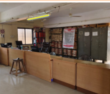
यामुळे वरिष्ठ अधिकारी कार्यालयाने पाटोदा तालुक्यातील दुय्यम निबंधक श्रेणी १ कार्यालयात सीसीटीव्ही कॅमेरे

पाटोदा । प्रतिनिधी राज्य सरकारी कर्मचाऱ्यांना पाच दिवसांचा आठवडा होऊनही कामकाजाच्या वेळी अनेक जण दांडी मारत आहेत. आसंच काही चित्र बीड जिल्हातील पाटोदा तालुक्यातील दुय्यम निबंधक श्रेणी-१ कार्यालयात पहायला मिळते. या दुय्यम निबंधक श्रेणी-१ कार्यालयातील अधिकारी कधीही वेळेवर कार्यालयात हजर रहात नाहीत तर कधी कधी दुपारनंतरच गायब असतात. त्यांच्यावर कोणाचाही धाक