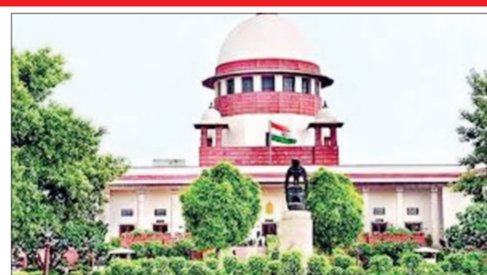
राबविल्या जाणाऱ्या मोफत योजनांवर बुधवारी (दि. १२) सर्वोच्च न्यायालयाने ताशेरे ओढले. शहरी भागातील बेघर लोकांना

नवी दिल्ली । वृत्तसंस्था लोकांना धान्य आणि पैसे मोफत मिळत राहिले तर त्यांना काम करण्याची इच्छाच राहणार नाही. त्यांना मोफत रेशन मिळत आहे आणि कोणतेही काम न करता पैसे मिळत आहेत. हे सांगणे दुःखद आहे; पण आपल्याला बेघर लोकांना मुख्य प्रवाहात सामिल करता येऊ शकत नाही का? ते देशाच्या विकासात योगदान देऊ शकणार नाहीत. अशा मोफत योजना राबवून आम्ही एक परावलंबी वर्ग तयार करत आहोत का, अशा शब्दांमध्ये सरकारकडून