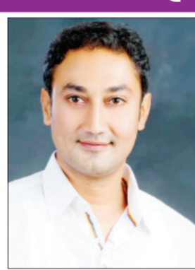
बीड नगरपालिका हद्द तसेच हद्दबाह्य भागात रस्त्यांचे काम