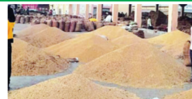
सोयाबीन खरेदीचा सावळा गोंधळ अजून संपलेला नाही. सोयाबीन उत्पादक शेतकऱ्यांना सरकारने केवळ झुलवत ठेवले आहे. या

शेतकऱ्यांच्या तोंडाला पान पुसल्याचे राज्य पणन महासंघाच्या एका आदेशाने समोर आले आहे. माध्यमशी बोलताना केंद्रीय कृषीमंत्री शिवराज सिंह चौहान यांनी सोयाबीन आणि भुईमुग खरेदीसाठी ९० दिवसांची मुदत वाढ दिल्याचा दावा करत स्वतःची पाठ थोपटून घेतली. तर दुसरीकडे नाफेडच्या खरेदी केंद्रावरील दूरच दूर रंगा त्यांना दिसल्या नाहीत. अजून हजारो शेतकऱ्यांची पान २ वर