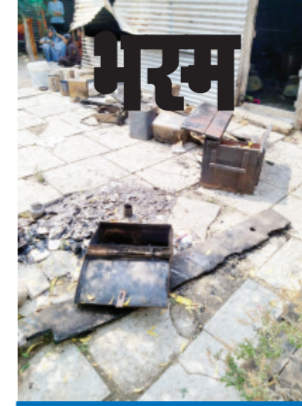
बडेवाडी येथील घटना

दिंडुड। प्रतिनिधी घराला शॉर्टसर्किटने आग लागून संसारोपयोगी साहित्य जळून खाक झाल्याची घटना माजलगाव तालुक्यातील बडेवाडी येथे शनिवारी रात्री बारा वाजे दरम्यान घडली.