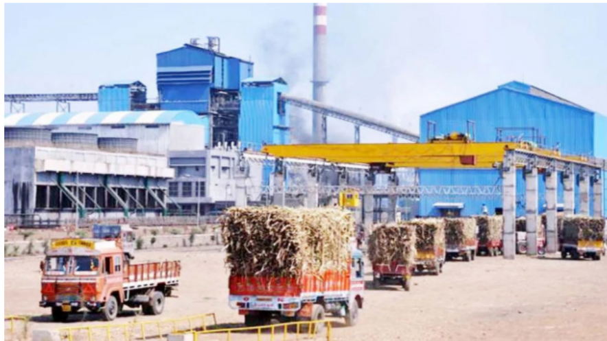
पण कार्यवाही झाली नव्हती, पण आता साखर सहसंचालक कार्यालयाने याबाबत भूमिका घेतल्याचे दिसते. ...या कारखान्यांचा समावेश

त्याच्यावरील पहिली सुनावणी आता १३ फेब्रुवारीला होणार आहे. या कारखान्यांच्या अध्यक्ष आणि व्यवस्थापक यांना या नोटिसा देण्यात आल्या आहेत. या आधीही संघटनेने या मागणीसाठी सतत पाठपुरावा करत आंदोलन केले.