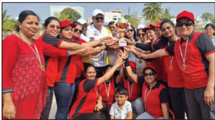
डॉक्टरस महिला क्रिकेट चषक स्पर्धा अंबाजोगाई

अंबाजोगाई प्रतिनिधी अंबाजोगाई मेडीकल प्रॅक्टीशनर्स असोसिएशनच्या अॅपा डॉक्टरस महिला चषक स्पर्धेत रॉयल फायर्स संघाने विजेतेपद पटकावले तर योगेश्वरी चॅम्पियन्स संघाला उपविजेतेपदावर समाधान मानावे लागले.