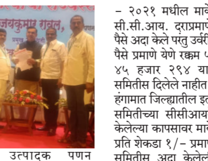
कापूस उत्पादक पणन महासभेसमार्फत हमीदराने १ लाख ६२ हजार ६४.९५ किंजल कापूस खरेदी केलेला असून प्रति शेकडा १/- प्रमाणे मार्केट फीस १/- प्रमाणे मार्केट फीस १ कोटी ४ लाख ७९ हजार ५५६ होते. सदरील फीसमधून राज्य पणन मंडळ पुणे यांनी दि. महाराष्ट्र राज्य सहकारी कापूस उत्पादक पणन महासभेस विभागीय कार्यालय परळी व. जि. बीड यांचेद्वारे २५ लक्ष अंशदान पोटी परस्पर वर्ग करून घेतले तर बाजार समितीस २४ लाख २६ हजार २६२ असे एकूण ४९ लाख २६ २६२ हंगाम २०२०

समितीने सा. सन २०१६ - १७ व सा. सन २०१७ - १८ या वर्षात शासकीय नाफड या, सहकारी मार्केट फेडरेशन मार्फत तुर, चना खरेदी केली होती. यासाठी माजलगाव बाजार समितीने खरेदी केंद्रावर आवश्यक त्या सोयी, सुविधा, कर्मचारी वर्ग सुविधा पुरविल्या होत्या. याठिकाणी शेतमाला खरेदीवरील बाजार फी व इतर अनुषंगीक खर्चाची रक्कम ५१ लाख ९१ हजार ५९७ थकीत असून संबंधित कार्यालयास बाजार समितीने पत्रव्यवहार करूनही फीस मिळालेली नाही. या फीस वसुलीसाठी पणन मंडळाकडून कसल्याही प्रकारची कारवाई करण्यात आलेली नाही व सहकार्यही मिळालेले नाही. त्यामुळे सदरील फीस बाजार समितीस मिळाली यासाठी संबंधित कार्यालयास निर्देश देऊन सदरील फीस मिळवून घ्यावी. बाजार समितीचे कार्यक्षेत्रात सा. स. २०२० - २१ मध्ये राज्य