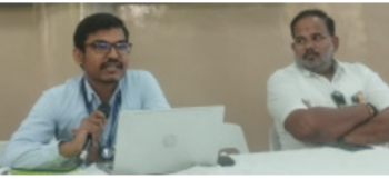
समर्थनाने जनजागृती पसरविण्यासाठी विविध उपक्रम हाती घेतात. पेट्रोलियम उत्पादनांच्या संवर्धनासाठी, इंधन कार्यक्षम उपकरणांना प्रोत्साहन देण्यासाठी आणि पेट्रोलियम संवर्धनासाठी धोरणे आणि धोरणे प्रस्तावित करण्यात सरकारला मदत करण्यासाठी तेल विपणन कंपनी (ओएमसी) आघाडीवर आहेत. त्याच कळकळीने सक्षम (संरक्षण क्षमता महोत्सव) २०२४-२५ ते २८ फेब्रुवारी, २०२५ दरम्यान आयोजित केले जातील, संपूर्ण देशभर ज्याची टॅगलाइन 'ग्रीन अँड

जालना । प्रतिनिधी संरक्षण क्षमता (महोत्सव) हा आपल्या देशाच्या ऊर्जा सुरक्षा, शाश्वत विकास आणि पर्यावरण संरक्षणासाठी भारत सरकारने सुरू केलेला एक महत्त्वाचा राष्ट्रीय कार्यक्रम आहे. अशी माहिती आज एका पत्रकार परिषद मध्ये जालना येथे देण्यात आली. या कार्यक्रमाचे अंतिम उद्दिष्ट म्हणजे जीवाश्म इंधनावरील वाया जाणारा खर्च रोखणे, परकीय तंत्रज्ञानावर वाढता भार कमी करणे आणि जीवाश्म इंधन जाळण्यामुळे निर्माण होणाऱ्या हरितगृह वायूच्या प्रतिकूल परिणामांपासून पर्यावरणाचे संरक्षण करणे. पेट्रोलियम आणि नैसर्गिक वायू मंत्रालय आणि तेल उद्योगाचे राज्यस्तरीय समन्वयक संबंधित राज्य सरकारच्या सक्रिय सहभागाने