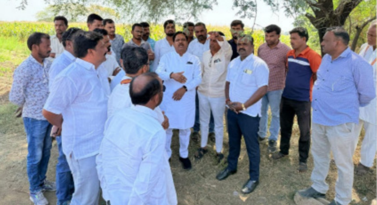
मध्ये प्रकल्पास अंतिम मान्यता देण्यात आली.