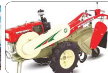
आज काढण्यात आला आहे. शेतकऱ्यांसाठी फायदे: शेतीकामांसाठी

इलेक्ट्रिक वाहनांचा वापर केल्यास शेतकऱ्यांचा इंधनावरील खर्च कमी होईल आणि पर्यावरणावर होणारा नकारात्मक प्रभावही कमी होईल. यामुळे वातावरणातील वायु प्रदूषणात घट होईल आणि शेतकऱ्यांना आर्थिकदृष्ट्या देखील फायदा होईल. याशिवाय, इलेक्ट्रिक वाहने जास्त वेळ चालतात, कमी देखभाल खर्च होतो आणि ऊर्जा वापरामुळे कमी इंधनाची आवश्यकता आहे.