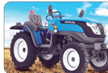
वाहनांचा समावेश धोरणात केला आहे. यासंबंधीच्या शासन निर्णयाचे शुद्धिपत्रक

इलेक्ट्रिक वाहनांना प्रोत्साहन देण्यासाठी आणि वातावरणातील प्रदूषण कमी करण्याच्या उद्देशाने राज्य सरकारने महाराष्ट्र इलेक्ट्रिक वाहन धोरण जाहीर केले होते. मात्र, सुरुवातीला या धोरणात शेतकऱ्यांसाठी उपयुक्त असलेल्या इलेक्ट्रिक ट्रॅक्टर, पाँवर टिलर आणि कटरचा समावेश नव्हता. त्यावर विचार करून, मंत्री पंकजा मुंडे यांनी या