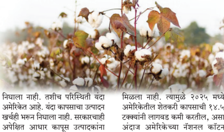
निघाला नाही. तशीच परिस्थिती यंदा अमेरिकेत आहे. यंदा कापसाचा उत्पादन खर्चही भरून निघाला नाही. सरकारचाही अपेक्षित आधार कापूस उत्पादकांना

नवी दिल्ली। वृत्तसंस्था गेल्या अनेक वर्षांपासून भारतात कापसाची लागवड केली जाते, महाराष्ट्रात विदर्भ आणि मराठवाड्यात कापसाचे मोठे क्षेत्र असून यंदा कापसाचा खर्चही शेतकऱ्यांना निघाला नाही. तसेच अमेरिकेतील कापूस उत्पादकांनाही यंदा पीक आतबट्ट्याचे ठरत आहे. उत्पादन खर्च न निघाल्यामुळे तेथे आता कापसाचे क्षेत्र घटणार आहे. महाराष्ट्रात कापसाला यंदा चांगला भाव मिळेल, अशी आशा शेतकऱ्यांना होती, मात्र भाव न मिळाल्याने खर्चही