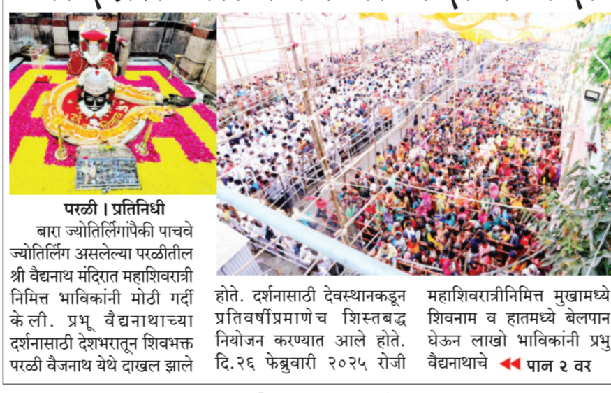
पारळी। प्रतिनिधी बारा ज्योतिर्लिंगांपैकी पाचवे ज्योतिर्लिंग असलेल्या पारळीतील श्री वैद्यनाथ मंदिरात महाशिवरात्री निमित्त भाविकांनी मोठी गर्दी केली. प्रभू वैद्यनाथांच्या दर्शनासाठी देशभरातून शिवभक्त पारळी वैजनाथ येथे दाखल झाले होते. दर्शनासाठी देवस्थानकडून प्रतिवर्षीप्रमाणेच शिस्तबद्ध नियोजन करण्यात आले होते. दि.२६ फेब्रुवारी २०२५ रोजी महाशिवरात्रीनिमित्त मुखांमध्ये शिवनाम व हातमध्ये बेलपान घेऊन लाखो भाविकांनी प्रभु वैद्यनाथाचे