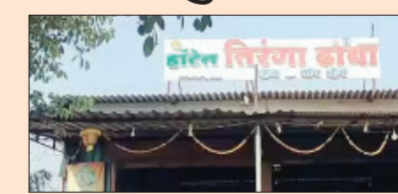
तिंगा हॉटेलवर जेवण केल्याचे तपासात समोर आले आहे. त्यामुळे याच हॉटेलवर