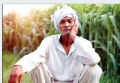
शेतकरी तसे गेल्या वर्षभरापासून कर्ज आहेत. लोकसभा निवडणुकीतही ही मागणी पुढे आली होती. पण विधानसभा निवडणुकीत या मागणीने

शेतकऱ्यांची कर्जे थकल्याने शेतकऱ्यांच्या अडचणी वाढल्या आहेत. खात्यात जमा झालेले लाभ किंवा माल विक्रीचे पैसे कर्ज खात्यात वळते केले जात असल्याचे शेतकरी सांगत आहेत. थकबाकीमुळे नविन कर्ज तर मिळत नाही. पण गेल्या दोन वर्षांपासून शेतीमालाचे बाजारभाव कमी आहेत. त्यातून उत्पादन खर्चही नियत नाही. मग कर्ज कसे भरायचे? अशा विचंचनेत शेतकरी आहेत. एकंदरीत कर्जामुळे शेतकरी एका चक्रव्यूहतात अडकले आहेत. त्यामुळे शेतकऱ्यांना कर्जमाफीची गरज आहे. कर्जमाफीची मागणी