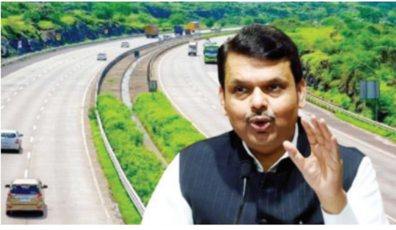
शेतकरीमिनीची रणभूमी झाली तर बेहतर आम्ही शक्तिपीठ महामार्ग करू देणार नाही, असा इशारा शक्तिपीठ महामार्ग विरोधी शेतकरी संघर्ष समितीने दिला आहे.

मुख्यमंत्री देवेंद्र फडणवीस यांनी शक्तिपीठ महामार्गाचे कामकाज सुरु करण्याचे सोमवारी (दि.१३) निर्देश दिले, आणि त्यावरून पुन्हा राजकारण तापायला सुरुवात झाली असून, शेतकरी संघटनांकडून विरोध सुरु झाला आहे. या शक्तिपीठ महामार्गासाठी कोल्हापूर वगळता उर्वरित ११ जिल्ह्यातील भूसंपादनाचे काम करण्याच्या हालचाली सुरु झाल्या आहेत. त्यामुळे