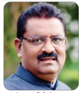
बीड: अभिनेत्री प्राजक्ता माळी या आमच्याकडे येतात.

पोलिस अधिकाऱ्यांच्या भेटीनंतर धनंजय मुंडेबाबत वक्तव्य