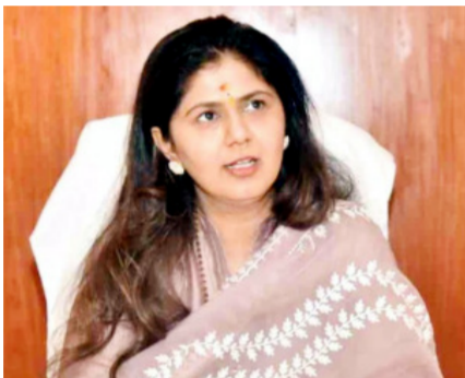
मुंबई। प्रतिनिधी पर्यावरण व वातावरणीय बदल आणि

मंत्रालयातील दालनात आजपासून सुरु केले कामकाज