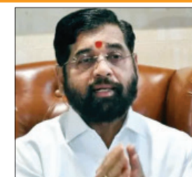
काही निर्णय घेतिले तो आम्हाला मान्य असेल असे

मी मुख्यमंत्री नाही तर काँग्रेस मॅन आहे. जनतेने महायुतीला भरघोस मते देत आमच्यावर विश्वास दाखवला. आता आम्ही जनतेला काय देणार हे महत्वाचे आहे. पंतप्रधान नरेंद्र मोदी आणि अमित शहा यांच्या निर्णयाला आमचा पाठिंबा असून ते जो