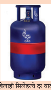
पान २ वर

वर्षाच्या शेवटच्या महिन्यातील डिसेंबरच्या पहिल्या तारखेला महाराष्ट्राचा मोठा झटका बसला आहे. तेल वितरण कंपन्यांनी एलपीजी गॅस सिलेंडरच्या किंमतीत वाढ केली आहे. विविध शहरातील कंपन्यांनी किंमती जाहीर केल्या आहेत. यानुसार १९ किलोच्या एलपीजी गॅस सिलेंडरच्या दरात १८ रूपयांपर्यंत वाढ झाली आहे. याआधी नोव्हेंबरच्या पहिल्या तारखेलाही सिलेंडरचे दर वाढले होते. दरम्यान, १४ किलोच्या सिलेंडरच्या दरात कोणतेही बदल करण्यात आलेले नाहीत.