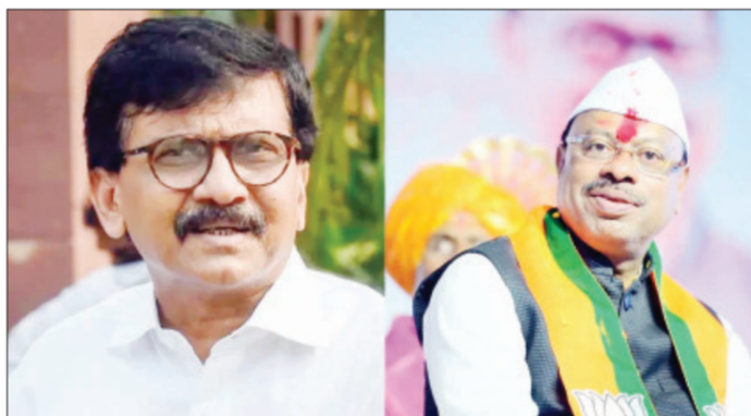
चंद्रशेखर बावनकुळे यांना खोचक सवाल करत बावनकुळे राज्यपाल आहेत का की राज्यपालांनी तसे बावनकुळे यांना सांगितले आहे, असा

राज्यातील संशयातीत बहुमत मिळविणाऱ्या महायुतीकडून अद्याप सत्ता स्थापनेचा दावा करण्यात आलेला नाही किंवा मुख्यमंत्री पदासाठी अधिकृत नावाची घोषणा केलेली नसतानाच भाजपाचे प्रदेशाध्यक्ष चंद्रशेखर बावनकुळे यांनी ५ डिसेंबर रोजी पंतप्रधान नरेंद्र मोदी यांच्या उपस्थितीत महायुती सरकारचा शपथविधी सोहळा होणार असल्याची घोषणा शनिवारी संध्याकाळी केली. त्यावरून शिवसेना उबाटा गटाचे खासदार तथा प्रवक्ते संजय राऊत यांनी