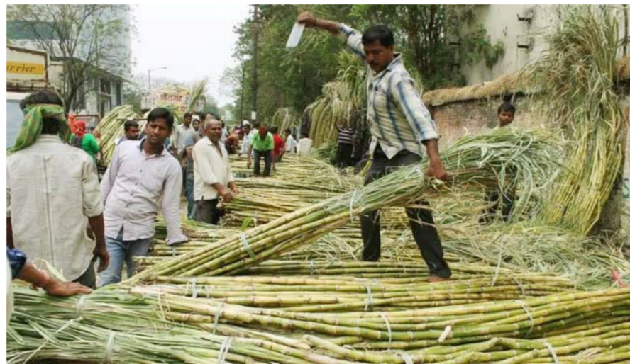
साखर कारखान्यांनीही तेवढा दर द्यावा, अशी मागणी शेतकऱ्यांनी केली आहे. तसेच धुराडे पेटून

केंद्र सरकारने पुणे विभागासाठी १०.२५ टक्के आधारभूत साखर उतारा निश्चित केला आहे. त्यानुसार प्रतिक्व्हेटल ३४० रुपये किफायतशीर दरानुसार प्रतिटन तीन हजार ४८५ रुपये दर ठरविला आहे. विधानसभा निवडणुकीच्या प्रचारात जिल्हातील विठ्ठल व विठ्ठलराव शिंदे या दोन्ही साखर कारखान्यांनी प्रतिटन साडेतीन हजार रुपये दर देण्याचे जाहीर केले आहे. जिल्हातील अन्य