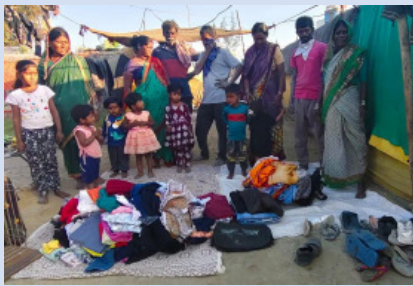
कपडे वाटपासाठी मानवलोकाचा प्रयत्न

अंबाजोगाई । प्रतिनिधी मानवलोक या सामाजिक संस्थेच्या वतीने रविवारी अंबासाखर कारखाना रोड, यशवंतराव चव्हाण चौक या ठिकाणी रोजी रोजी कमवण्यासाठी आलेल्या गरजवंत कुटुंबांना, जुने स्वच्छ कपड्यांचे वाटप करण्यात आले. गेल्या अनेक वर्षांपासून मानवलोक च्या वतीने हा उपक्रम सुरू आहे. अंबाजोगाईतील शहरातील गरजवंत लोक कपडे घेऊन जातात.