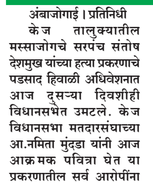
अटक करून तत्काळ फाशीची शिक्षा द्यावी अशी मागणी सभापतींकडे केली.