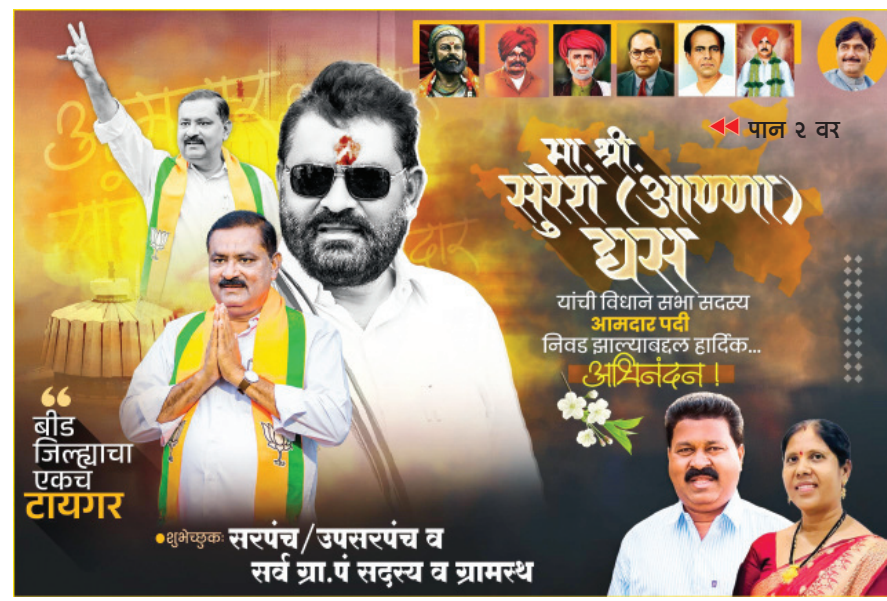
यांची विधान सभा सदस्य आमदार पती निवड झाल्याबद्दल हार्दिक... अभिनंदन!