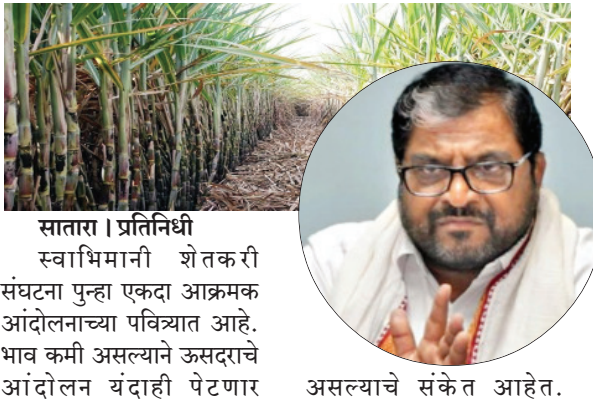
सातारा। प्रतिनिधी स्वाभिमानी शेतकरी संघटना पुन्हा एकदा आक्रमक आंदोलनाच्या पवित्र्यात आहे. भाव कमी असल्याने ऊसदराचे आंदोलन यंदाही पेटणार

पहिली उचल ३७०० रुपये जाहीर करा, अन्यथा तीव्र आंदोलन करणार-राजू शेटी