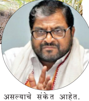
असल्याचे संकेत आहेत.