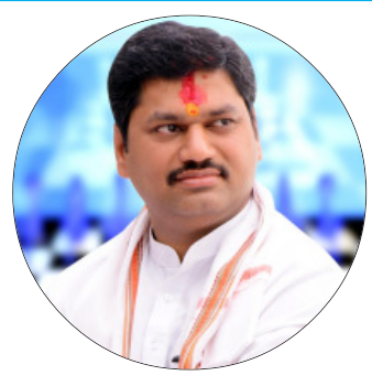
उमेदवारांची यादी जाहीर करण्यात आली. यामध्ये सर्वाधिक हाय च्चोलेटजमध्ये असणाऱ्या परळी विधानसभा मतदारसंघातून उमेदवार