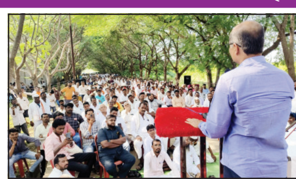
आणि सर्व सामान्य माणसाच्या पुण्याईवर अपक्ष उमेदवार म्हणून निवडणूक रिंगणात आहे. आता, मायबाप जनतेचे न्याय द्यावा, असे भाविक आवाहन आमदार

मतदारसंघातील रस्ते, पाणी आणि वीज, या तीन महत्वाच्या गोष्टींवर लक्ष देऊन, हे अत्यावश्यक प्रश्न सोडविण्याचा प्रयत्न केला. दहा वर्षात, नाटकेवारी घेतली, ना कुणा विरोधकांना जाणीवपूर्वक त्रास दिला. सर्व सामान्य माणसाने दिलेल्या आमदारीच्या उपयोग केवळ मतदारसंघातल्या विकास कामासाठी उपयोगात आणली. कुणाचा ही तळतळाट लागेल, असे एक ही काम मी कधीही केले नाही. त्यामुळे, कार्यकर्त्यांच्या पाठबळावर