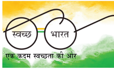
एक कदम स्वच्छता की ओर

केवळ १५ ग्रामपंचायती हर घर जल घोषित झालेल्या आहेत. तर ९९ ग्रामपंचायती ही कामे १००% पूर्ण झालेली आहेत यावरून असे निदर्शनास आले की जलजीवन मिशनमध्ये मोठ्या प्रमाणात निधी खर्च झाला. मात्र त्या प्रमाणात कामे अत्यल्प पूर्ण झाली. केवळ पाच महिने राहिले असताना १५ ग्रामपंचायती हर घर जल घोषित होतात म्हणजे कामाच्या वेग किती आहे हे लक्षात येते. या बाबीकडे यंत्रणेने महिने राहिले असताना १५ ग्रामपंचायती नमूद केले असून अशी परिस्थिती राहिली तर जिल्ह्याचे काम कसे पूर्ण होणार असे म्हणत