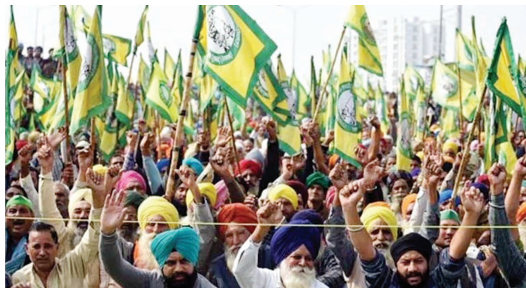
धोरणास विरोध करणायला आला. तसेच सरकार फक्त कॉर्पोरेटस यांच्या मागे उभे राहत असल्याचाही आरोप करणायला आला आहे. याचमुळे याच केंद्र सरकारला निषेध एसकेएमने केला आहे. तर डिजिटल कृषी मिशन शेतीचे कॉर्पोरेटीकरण

मुंबई । प्रतिनिधी संयुक्त किसान मोर्चाचे २६ नोव्हेंबर रोजी देशातील ५०० जिल्ह्यांमध्ये चेतावणी रॅली काढण्याची घोषणा केली आहे. २०२० मध्ये तीन कृषी कायद्यांविरुधात दिल्ली येथे आयोजित चौथ्या वर्षीपासून दिवानिमित्त निषेध केला जाईल. यासोबतच महाराष्ट्र, झारखंडच्या प्रचारात भाजपला संयुक्त किसान मोर्चा विरोध करेल असाही निर्णय सुरजित भवन, नवी दिल्ली येथे झालेल्या सर्वसाधारण सभेत घेण्यात आला. संयुक्त किसान मोर्चाच्या बैठकीत केंद्र सरकार डिजिटल ऑनिकल्चर मिशन (डॅम) च्या माध्यमातून शेती कॉर्पोरेटच्या ताब्यात देत आहे. या