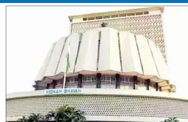
राज्यात आचारसंहिता लागू झाली. राज्य सरकारने बुधवारी दुपारी ३.३० नंतर अनेक शासन निर्णयांची घोषणा केल्याने याबाबत निवडणूक आयोगाने चौकशीचे संकेत दिले. त्यानंतर मंत्रालयातील

मुंबई । प्रतिनिधी राज्यात विधानसभा निवडणुकीच्या अनुषंगाने आचारसंहिता लागू झाल्यानंतरही जाहीर करण्यात आलेल्या शासन निर्णयांची चौकशी केली जाणार असल्याचे आधीच राज्य निवडणूक आयोगाने स्पष्ट केले आहे. आयोगाच्या या पवित्र्यांतर प्रशासनाने एका तासात १०० शासन निर्णय रद्द केले असल्याची माहिती सुत्रांनी दिली. आता या प्रकरणी आयोगाने प्रशासनाकडे सविस्तर अहवालाची मागणी केली आहे. आगामी विधानसभा निवडणुकीसाठी केंद्रीय आयोगाने निवडणूक कार्यक्रम नुसतःच जाहीर केला आहे. या घोषणेनंतर