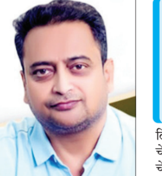
अंबड। प्रतिनिधी समृद्धी साखर कारखान्याच्या सर्व ऊस उत्पादक शेतकऱ्यांना गळीत हंगाम २०२३-२४ मधील गाळवाड्या उसाचा पहिला २८०० रुपये प्रति मे. टन प्रमाणे देण्यात आला. आता

कपाशी, सोयाबीन या पिकांचे अतिवृष्टीत नुकसान झाले आहे. त्यामुळे शेतकऱ्यांचे आर्थिक नुकसान झाले असून हातात पैसा आला नाही. आर्थिक अडचणीत आलेल्या शेतकऱ्यांना आधार देण्यासाठी समृद्धीने १०० रुपयांचा वाढीव हप्ता देण्याचा निर्णय घेतला. लवकरच शेतकऱ्यांच्या खात्यात ही रक्कम जमा होईल.