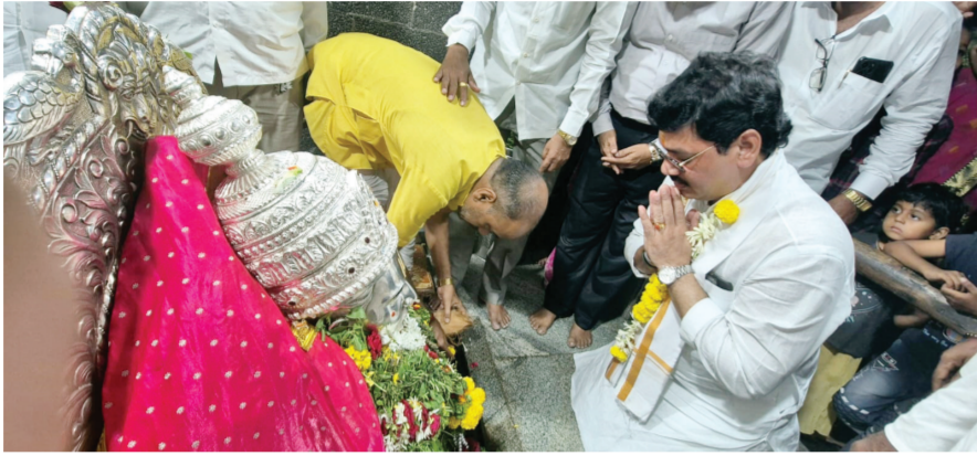
बीड: ना.धनंजय मुंडे हे एका कार्यक्रमात आळंदी देवाची येथे आले असता, त्यांनी संत ज्ञानेश्वर माऊली संजीवन समाधीचे दर्शन घेऊन आशीर्वाद घेतले.