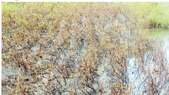
सोयाबीनची काढणी करताना दिसत आहेत. गेल्या दोन दिवसापासून दोन्ही जिल्ह्यात परतीच्या पावसाने हजेरी लावण्यास सुरुवात केली आहे. यंदा पावसाळ्यात चांगला पाऊस पडल्याने

बहरात असलेले सोयाबीनचे पीक काढणीला येताच परतीच्या पावसाने दोन्ही जिल्ह्यात धुमाकूळ घातला असून हाता तोंडाशी आलेले पीक पुन्हा पाण्याखाली गेले आहे. यामुळे शेतकऱ्यांचे मोठे नुकसान झाले असून आपखी पावसाची शक्यता असल्याने शेतकरी हवालदिल झाले आहे. दुसरीकडे मजुरांकडून शेतकऱ्यांची अडवणूक सुरू झाली असून पावसाच्या भीतीने शेतकरी मोठी मजुरी देऊन