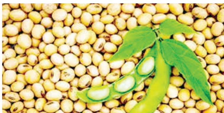
सध्या मध्य प्रदेश आणि महाराष्ट्रातील शेतकरी सोयाबीन हमीभाव नको तर त्यापेक्षा जास्त भाव पाहीजे यासाठी आंदोलन करत आहेत. मध्य प्रदेशातील

सोयाबीनला हमीभाव घ्यायचा की शेतकरी मागतात त्याप्रमाणे ६ हजार रुपये भाव घ्यायचा हे आता सरकारच्या हातात आहे. शेतकरी म्हणतात त्याप्रमाणे हमीभावाने खरेदी करून सरकारने किटलला ११०० रुपयांचा बोनस दिला तर शेतकऱ्यांना ६ हजार रुपये भाव पडेल. वर यासाठी सरकारला शेतकऱ्यांना केवळ १२ ते १४ हजार कोटी रुपये घ्यावे लागतील. आता सरकार नको तिथे एवढा खर्च करत मग शेतकऱ्यांसाठी १२ ते १४ हजार कोटी रुपये देऊ शकत नाही का? असा प्रश्नही शेतकरी विचारत आहेत.