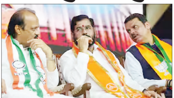
मुंबई । प्रतिनिधी महायुतीमधील तीन पक्षात काही आलंबेल नसल्याची टीका सातत्याने होत असते. मात्र, महायुतीमध्ये सर्वकाही आलंबेल आहे, पुढील महिन्याच्या पहिल्या आठवड्यापर्यंत तिन्ही पक्षातील