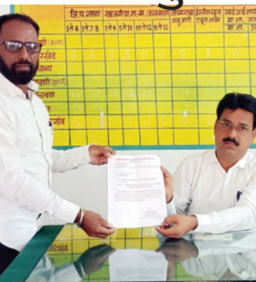
अजून पर्यंत शाळेसाठी सामान्य शाळेत टाकून संबंधित स्वच्छालय उभारले नाही.हे कंत्राटदार

वडवणी | प्रतिनिधी वडवणी तालुक्यातील कवडगाव हे पंचायत समिती सर्कलचे गाव असून या ठिकाणी जिल्हा परिषदेची सातवीपर्यंत शाळा असून या शाळेत गेल्या अनेक वर्षांपासून स्वच्छालयाची दुरावस्था झाली आहे. शाळेला स्वच्छालय नसल्यामुळे विद्यार्थी विद्यार्थिनींची गैरसोय होत आहे. या गंभीर घटनेची दखल संबंधित शिक्षक विभागाने घ्यावी तसेच गेल्या चार-पाच महिन्या पूर्वी स्वच्छालय उभारण्यासाठी रॅपिडेट सामान्य शाळेत येऊन पडले आहे.