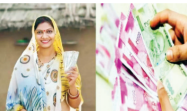
९४.३४% अर्जांची छाननी करून स्वीकृती मोबाईल संदेश

बीड | प्रतिनिधी बीड जिल्ह्यामध्ये आतापर्यंत ३ लाख ५२ हजार ८८० महिलांनी मुख्यमंत्री माझी लाडकी बहीण या योजनेमध्ये अर्ज दाखल केले असून ९४.३४ % टक्के अर्जांची छाननी करून मोबाईलव्दारे स्वीकृती संदेश देण्यात आले आहेत. मुख्यमंत्री माझी लाडकी बहीण योजनेमध्ये लाभार्थी महिलांची नोंदणी आणि अर्जांची पडताळणी करण्याची विशेष मोहीम जिल्हयात सुरू असून याअंतर्गत ३ लाख ५२ हजार ८८० महिलांनी दाखल केलेल्या अर्जांची छाननी करून ३,३२,८९२ लाभार्थी महिलांच्या अर्जांना स्वीकृती देऊन मोबाईल संदेश पाठविण्यात आलेले असून आजपर्यंत ९४.३४ % टक्के काम झालेले आहे. ज्यांचा ऑनलाईन अर्ज भरताना