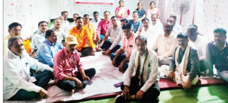
स्वामी विवेकानंद शिक्षक सहकारी पतसंस्थेत विशेष लेखा परीक्षकांना आढळली आर्थिक अनियमितता ; पत्रकार परिषदेत माजी संचालकांची माहिती