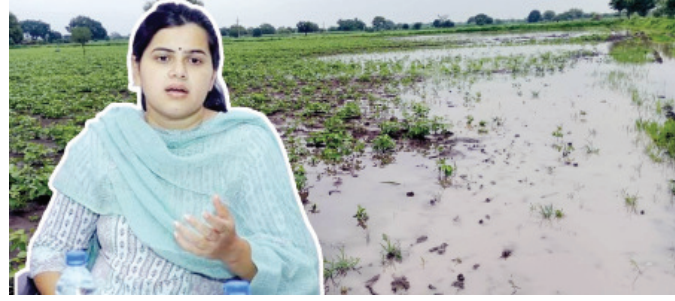
अंबाजोगाई तालुक्यातील पाटोदा, देवळा, अंजनपुर, कोपरा, तटबोरगाव या गावात व परिसरात अतिवृष्टी व सततच्या पावसामुळे सोयाबीन, तुर, मूग