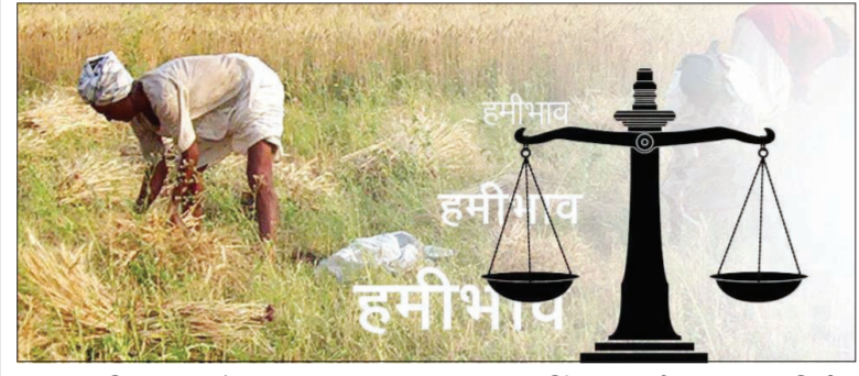
नवी दिल्ली। वृत्तसंस्था हरियाणा सरकारने राज्यातील २४ पिके हमीभाव किंमतीवर खरेदी करण्याचा निर्णय कॅबिनेट मंत्रिमंडळाच्या बैठकीत घेतला.