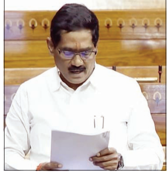
नवी दिल्ली। वृत्तसंस्था माध्यम बीड जिल्ह्याला ऊसतोड कामगारांचा जिल्हा अशी ओळख आहे. याठिकाणी ऊसतोड कामगारांचा नावावर केवळ राजकारण