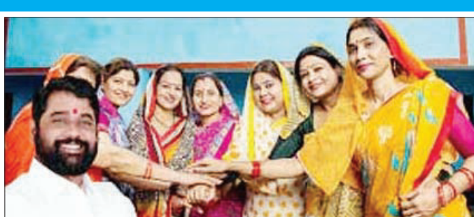
यावा, तसेच त्यांच्या आरोग्यमानात सुधारणा व्हावी यासाठी एलपीजी गॅसचा वापर सर्वात सुरक्षित आहे. परंतु गॅस जोडणीधारकांना बाजार दराने

राज्यातील गरीब कुटुंबांना वार्षिक तीन गॅस सिलिंडर पुनर्भरण मोफत देणारी मुख्यमंत्री अन्नपूर्णा योजना राज्य शासनाने जाहीर केली आहे. या योजनेच्या सुलभ लाभ घेता यावा यासाठी लाभार्थींनी त्यांच्या संबंधित गॅस एजन्सीकडे जाऊन ई-केवायसी करावी. तसेच लाभार्थ्यांचे बँक खाते आधार सलप करून घ्यावे, असे आवाहन अन्न व नागरी पुरवठा विभागामार्फत करण्यात आले आहे. गरीब कुटुंबातील महिलांना धूम्रमुक्त वातावरणात स्वयंपाक करता