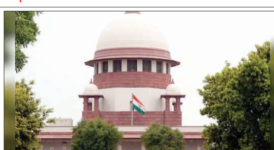
उस्मानाबाद या शहरांचे अनुक्रमे छत्रपती संभाजीनगर आणि धाराशिव असे नामांतर करण्याचा निर्णय महाराष्ट्र राज्य प्राधिकरणाने घेतला होता. या