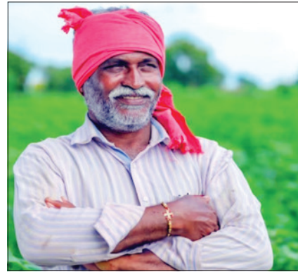
राज्यातील सर्व शेतकरी कर्जमाफीची वाट पाहत आहेत. कर्जमाफीवरून अनेक चर्चाही सुरु आहेत.

सत्ताध्यांच्या शेतकऱ्यांच्या नाराजीचा चांगलाच फटका बसणार, याची जाणीव आहे. शेतीमाल बाजारभावाचा मुद्दा शेतकऱ्यांच्या अजेंड्यावर दिसतो. त्यामुळे विधानसभा निवडणुकीत कोणतीही जोखीम घेण्यास सत्ताधारी तयार नाहीत. शेतकऱ्यांची नाराजी दूर करण्यासाठी सरकार निवडणुकीच्या तोंडावर सर्व ते प्रयत्न करत आहे. त्याचाच एक भाग म्हणजे १४ हजार कोटींची मोफत वीज योजना आणि सव्याचार हजार कोटींची कापूस, सोयाबीनला हेक्टरी ५ हजार रुपये मदतीची योजना म्हणून सरकारने जाहीर केली. आता कर्जमाफीही विधानसभा निवडणुकीच्या आधी करण्याची अपेक्षा सरकारला जाणवू लागली आहे.