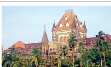
याबाबत माजी मुख्यमंत्री उद्धव ठाकरे यांनी शुक्रवारी (दि.२३) पत्रकार परिषदेत बंद मागे घेत असल्याचे सांगितले. महाविकास आघाडीने शनिवारी

बदलापूर घटनेच्या निषेधार्थ महाविकास आघाडीने शनिवारी (दि.२४) पुकारलेला बंद अखेर मागे घेतला आहे. या बंदबाबत उच्च न्यायालयाने मनाई केली होती. न्यायालयाच्या या निर्णयानंतर राष्ट्रवादी काँग्रेस शरद पवार गटाचे अध्यक्ष शरद पवार यांनी बंद मागे घेण्याचे आवाहन केले होते. त्यामुळे महाविकास आघाडीचे घटक पक्ष काँग्रेस आणि शिवसेना ठाकरे गटाने हा बंद मागे घेण्याचे जाहीर केले आहे.