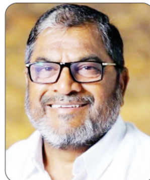
कोणताही निर्णय अद्यापही घेतलेला नाही. सांगली व कोल्हापूर जिल्ह्यातील ऊस उत्पादक शेतकरी मुख्यमंत्री एकनाथ शिंदे यांच्या मध्यस्थीने