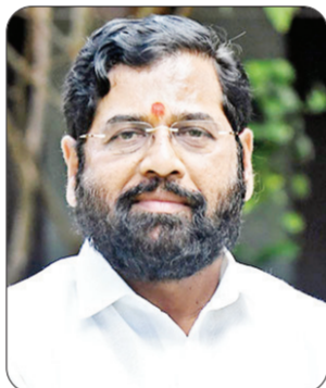
कारखान्यांनी ५० रुपये दुसरा हमा देण्याबाबत तातडीने कार्यवाही करण्याची मागणी स्वाभिमानीकडून करण्यात आली. परंतु सरकारने मागच्या ८ महिन्यात यावर

मुख्यमंत्री व कोल्हापूरचे पालकमंत्री यांच्या मध्यस्थीने सन २०२२-२३ या गळीत हंगामात तुटलेल्या उसाला प्रतिटन ३ हजारोपेक्षा कमी दर दिलेल्या कारखान्यांनी प्रतिटन १०० रुपये व ३ हजारोपेक्षा जादा दर दिलेल्या