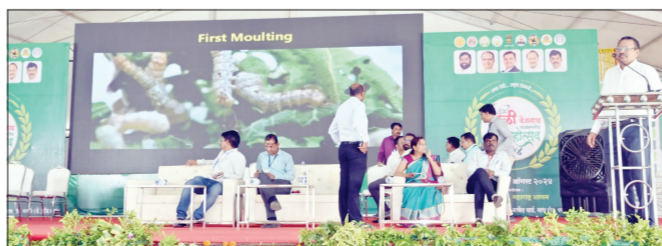
रेशीम शेती हा अत्यंत उपयुक्त पर्याय आहे. तुती, रेशीम कीटकांचे जीवनचक्र, खाद्य, कीड व्यवस्थापन,

प्रदर्शनास शेतकरी बांधवानी उदंड प्रतिसाद दिल्याचे पाहायला मिळत आहे. कृषी प्रदर्शनात उभारण्यात आलेल्या विविध कृषी उत्पादने व उमेद अभियानातील महिला बचत गटांच्या स्टॉल्स वर खरेदीसाठी पुरुषांसह महिलांची देखील मोठी गर्दी उरल्याचे पाहायला मिळाले. तांत्रिक सत्रात रेशीम शेतीवर मार्गदर्शन बदलत्या व असंतुलीत हवामानात शाश्वत उत्पन्नाच्या दृष्टीने