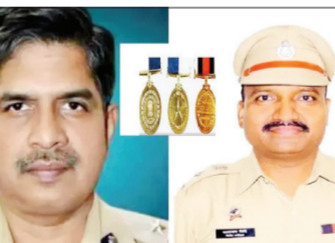
पान २ वर

करण्यासाठी उल्लेखनीय शौर्यासाठी दिले जाते. विशिष्ट सेवेसाठी 'राष्ट्रपती पोलीस पदक' पोलीस सेवेतील खास उल्लेखनीय कामगिरीसाठी दिले जाते. गुणवत्तापूर्ण