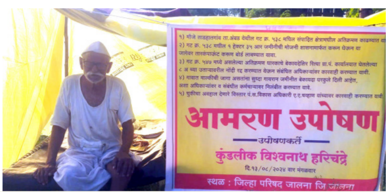
अतिक्रमण धारकांना नोटीसा ताडहादावांग येथील पाझर तलाव क्रमांक ५३८ संपादीत क्षेत्रातमधे अतिक्रमण केल्याचे प्रथमदर्शनी लघुपाटबंधारे जलसंधारण जि.प. जालना यांना दिसून आले आहे.