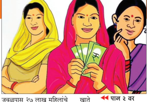
जवळपास २७ लाख महिलांचे खाते पान २ वर

लाडकी बहिणी योजनेचा प्रत्यक्षात लाभ मिळायला सुरुवात झाली. ३-४ दिवसांवर येऊन ठेपलेल्या रक्षाबंधनचे पवित्र औचित्य साधून स्वातंत्र्यदिनाच्या पूर्वसंध्येला महाराष्ट्रातील बहिणींना मुख्यमंत्री माझी लाडकी बहिणी योजनेचा लाभ मिळायला सुरुवात झाली आहे. ३१ जुलैपूर्वी अर्ज सादर केलेल्या बहिणींच्या बँक खात्यावर जुलै आणि ऑगस्ट या २ महिन्यांच्या लाभार्थी रकम, प्रत्येकी ३००० रुपये वर्ग करण्यात आले आहेत. ३१ जुलै नंतर अर्ज सादर केलेल्या बहिणींच्या खात्यावरही लवकरच लाभार्थी रकम जमा करण्यात येणार आहे. दरम्यान, अर्ज दाखल केलेल्या