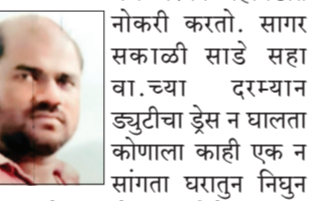
पान २ वर

परळी येथे थर्मल पॉवर स्टेशन येथे मॅस्को महामंडाट नोकरी करतो. सागर सकाळी साडे सहा वा.च्या दरम्यान ड्युटीचा ड्रेस न घालता कोणाला काही एक न सांगता घरातून निघून गेला आहे. असा निरोप त्याच्या पत्नीने पान २ वर