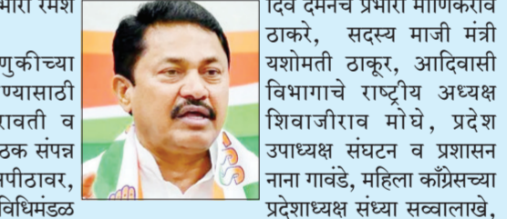
पान २ वर

अमरावती। प्रतिनिधी महायुती सरकारने शेट्टाचाराचा कळस गाठला आहे. शेतकऱ्यांच्या नावाने योजना काढून त्यातूनही पैसा खाल्ला आहे. महाराष्ट्राला बेरोजगारीचे राज्य बनवले आहे. भाजपा युती सरकारचे विकासाचे मॉडेल हे केवळ दिखावा आहे. विकासाच्या नावाखाली सर्रास लूट सुरु आहे. असा आरोप करीत महाराष्ट्राला वाचविण्यासाठी आता भ्रष्ट सरकारला पायउतार करावेच लागेल, असे प्रतिपादन काँग्रेसचे प्रदेशाध्यक्ष नाना पटोले यांनी केले. यावेळी महाराष्ट्राची निवडणूक देशासाठी महत्त्वाची असून, राज्यातील सत्ताबदलाचे हादरे दिल्लीलाही बसणार आहेत, असे प्रभारी रमेश चेत्रीला म्हणाले. विधानसभा निडणुकीच्या तयारीचा आढावा घेण्यासाठी अमरावती येथे अमरावती व यवतमाळ जिल्ह्याची बैठक संपन्न झाली, यावेळी व्यासपीठावर, प्रदेशाध्यक्ष नाना पटोले, विधिमंडळ काँग्रेस पक्षाचे नेते बाळासाहेब थोरात, अखिल भारतीय काँग्रेस कमिटीचे सरचिटणीस मुकुल वासनिक, उत्तर प्रदेशचे