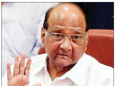
राह. सर्वपक्षीय बैठकीला मनोज जरांगे यांनाही निमंत्रित करावे. याशिवाय, ओबीसीचे नेतृत्व

पुणे। प्रतिनिधी आरक्षणाची ५० टक्क्यांची मर्यादा ओलांडण्याचा अधिकार केंद्र सरकारला आहे. केंद्राने हे धोरण बदलले पाहिजे. केंद्र सरकारने त्यासाठी पुढाकार घेतला पाहिजे. केंद्र सरकारने धोरण बदलण्याची भूमिका घेतली तर आम्ही त्यांना पाठिंबा देऊ अशी स्पष्ट भूमिका राष्ट्रवादी काँग्रेस शरदचंद्र पवार पक्षाचे प्रमुख शरद पवार यांनी पुण्यात प्रसारमाध्यमांशी बोलताना मांडली. शरद पवार पुढे बोलताना म्हणाले की, मुख्यमंत्र्यांनी सर्व पक्षीय बैठक बोलवावी. या बैठकीला विरोधी पक्षाच्यावतीने आम्ही हजर