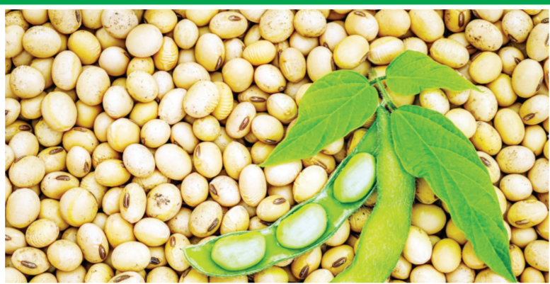
या परिस्थितीमुळे मराठवाड्यातील सोयाबीन उत्पादक शेतकऱ्यांचे संकट आले आणि अनेक शेतकऱ्यांचा उत्पादन खर्चही निघाला नाही. याबाबत शासनाकडे मदतीसाठी आवाज उठविला होता, मात्र शासनाकडूनही ना योग्य मदत मिळाली ना

संभाजीनगर। प्रतिनिधी महाराष्ट्रात खरीपात मराठवाड्यात सर्वाधिक पेरल्या जाणाऱ्या सोयाबीनवर आता पुन्हा एकदा पिवळ्या मोझॅकसह विषाणुजन्य हिरवा मोझॅकचा प्रादुर्भाव दिसून आला आहे. मराठवाड्यातील आठही जिल्ह्यांत या रोगाचा प्रादुर्भाव दिसून आल्याने सोयाबीन उत्पादनात जवळपास ७५ टक्क्यांची घट होण्याची शक्यता आहे. त्यामुळे शेतकऱ्यांसमोर मोठे संकट उभे राहिले आहे. मागील वर्षी मराठवाड्यातील सोयाबीन उत्पादक शेतकऱ्यांचे पावसाच्या लहरीपणातून मोठे नुकसान झाले होते. सरासरीपेक्षा कमी पाऊस आणि नंतर अतिवृष्टीमुळे सोयाबीनवर पिवळा मोझॅक रोगाचा प्रादुर्भाव झाल्याने सोयाबीन पिकाने माना टाकल्याचे दिसून आले होते. यानुही काही शेतकऱ्यांचे पीक वाचले मात्र त्यांना शेवटपर्यंत योग्य भाव मिळाला नाही. एकंदर