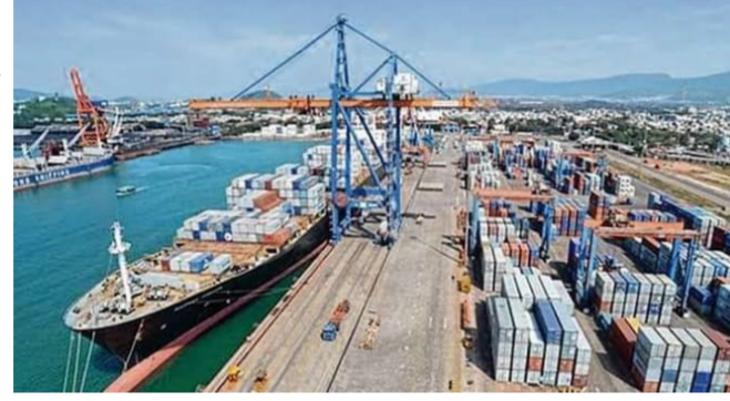
शेतकऱ्यांना होणार फायदे!

मुंबई : उरणजरीकच्या शेवा बंदराच्या परिसरातील २७ एकर जमिनीवर कृषी मालावर एकात्मिक पद्धतीने प्रक्रिया करून साठवणुकीची व्यवस्था पुरवणारे केंद्र उभारण्याचा निर्णय जवाहरलाल नेहरू बंदर प्राधिकरणाचे घेतला आहे. मोठ्या प्रमाणात दर्जेदार उत्पादन घेऊनही साठवणूक तसेच प्रक्रिया केंद्राची सुविधा नसल्यामुळे कृषी मालाची परदेशात विक्री न करू शकणाऱ्या शेतकऱ्यांना यामुळे दिलासा मिळणार आहे. अशा प्रकारचा हा देशातील पहिलाच प्रकल्प असणार आहे.