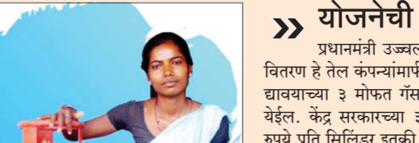
या योजनेचा लाभ मिळण्यासाठी गॅस जोडणी व हिलेचेला नावाने असणे आवश्यक आहे. राज्यातील प्रधानमंत्री उज्वला योजनेतर्गत पात्र असलेले लाभार्थी या योजनेसाठी पात्र असणार आहेत. मुख्यमंत्री माझी लाडकी बहीण योजनेस पात्र असलेल्या लाभार्थ्यांचे कुटुंब या योजनेस पात्र असणार आहे. एका कुटुंबात शिधापत्रिकेनुसार केवळ एक लाभार्थी या योजनेस पात्र असेल. तसेच फक्त १४.२ किलोग्रॅम वजनाच्या गॅस सिलिंडरची जोडणी असलेल्या गॅस ग्राहकांना ही योजना लागू असेल.

योजनेअंतर्गत महिलांना वर्षाला तीन गॅस सिलिंडर मोफत मिळणार आहेत. तर राज्यातील ५२.९६ लाख महिलांना याचा लाभ मिळणार आहे. राज्यातील लाडक्या बहिणींसाठी मुख्यमंत्री एकनाथ शिंदे यांनी