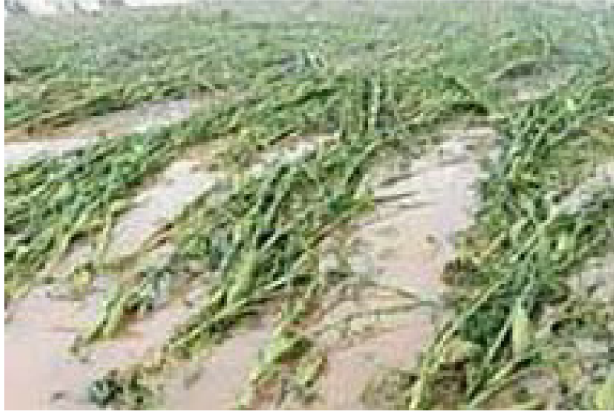
पिक पाण्यात राहिल्यास तो कुजण्याची शक्यता आहे. दूधगांवा, कृष्णा आणि वारणा नदीच्या पुराने

राधानगरी धरणाचे २ दरवाजे अजूनही सुरू आहेत. जिल्ह्याच्या पश्चिम भागामध्ये थांबून हलक्या स्वरूपात पाऊस सुरू आहे. पूर्व भागातील अनेक तालुक्यांमध्ये ढगाळ हवामान व ऊनही पडल्याचे चित्र आहे. आतापर्यंत चौस हजार हेक्टरहून अधिक शेती पाण्याखाली आहे. पाणी जास्त दिवस शेतात साचल्याने खरीप पिकांचे पूर्ण नुकसान अटळ बनले असल्याचे शेतकऱ्यांनी सांगितले. जिल्ह्यात भात, ऊस, सोयाबीन, भुईमुग पीक पाण्याखाली आहे. याचा सर्वाधिक फटका ऊस पिकाला बसला आहे. जिल्ह्यात ३०० हून अधिक गावांमधील अंदाजे २५ हजार हेक्टर पिकाऊ शेती पुरात बुडाली आहे. आणखी काही दिवस पुराचे पाणी ओसरले नाही, तर पिकांना मोठ्या प्रमाणात फटका बसणार आहे. नदीकाठच्या ऊस पिकला सर्वाधिक फटका बसला आहे. सुरळीत पाणी गेल्याने आणखी काही दिवस ऊस