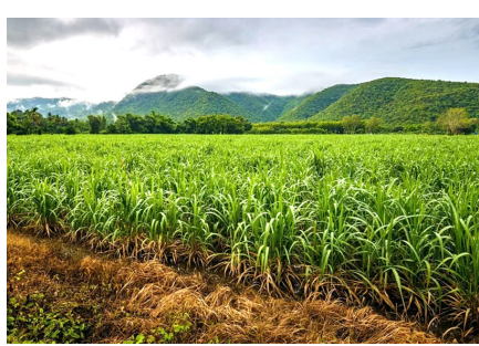
हंगामनिहाय व्यवस्थापन :

अवर्षण काळात तापमान वाढीमुळे बाष्पीभवनाचा वेग वाढतो. जमिनीतील उपलब्ध पाण्याचे प्रमाण कमी होते. मुळांच्या कार्यक्षमता कमी होते. त्यामुळे मुळाद्वारे पाणी आणि अन्नद्रव्यांचे शोषण कमी होते. हीरतद्रव्यांचे प्रमाण घटल्यामुळे उसाची पाने पिवळी पडू लागतात. पूर्ववाह व जोमदार वाढीवर प्रतिकूल परिणाम होतो. त्यामुळे कांड्यांची लांबी आणि जाडी कमी होऊन वजनात घट येते. उसांमध्ये तंतुमय पदार्थांच्या प्रमाणात वाढ होऊन दरीचे प्रमाण वाढते. साखर चयापचय क्रियांवर परिणाम होऊन निर्मिती व उतारा घटतो. पाण्याचा तीव्र ताण बसल्यास वाह खुंटते. कधी कधी सरळ उंच वाढण्याऐवजी डोळे फुटून पागशा फुटतात.