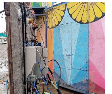
आठ ते दहा दिवसांपूर्वी केज शहरात पंचायत समितीच्या प्रांगणावर आनंदनगरी आलेली आहे. सदर रोहित्रा मधून महा वितरण कार्यालयाने आनंद नगरीला वीज पुरवठा दिला आहे. परंतु सदर रोहित्राचे वीज पुरवठा करणारे केबल (वायर) हे जमिनी वर पावसात, पाण्यात, चिखलात उघडे आहे सदर केबलला जाईट

केज । प्रतिनिधी महावितरण कार्यालयाच्या गलथान कारभारामुळे विद्यार्थी व नागरिकांच्या जीवितास धोका निर्माण झाला असून महावितरण कार्यालयाच्या विद्युत रोहित्राच्या बोर्डामधुन आनंद नगरीला वीज पुरवठा करणारे केबल जमिनीवर भर पावसात व पाण्यात उघड्यावरच आहेत यास जबाबदार कोण? असा सवाल नागरिकांतून उपस्थित केला जात आहे. या बाबतची सविस्तर माहिती अशी की, पंचायत समिती च्या प्रांगणामध्ये महा वितरण कार्यालयाचे दोन विद्युत रोहित्र आहेत सदर रोहित्राचे वीज पुरवठा करणारे केबल (वायर) उघड्यावर आहेत व या रोहित्राचे पयुज फुटलेले आहेत. मागील