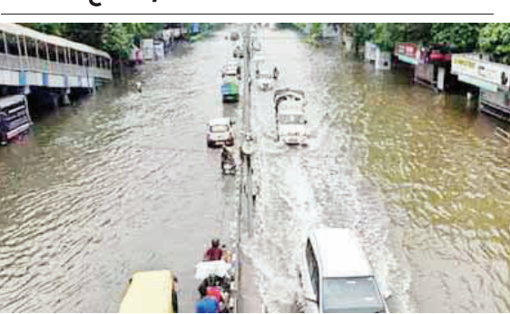
पुणे । प्रतिनिधी मुंबईसह पालघर, ठाणे, मुंबई, सिधुदुर्ग, पुणे, कोल्हापूरला शुक्रवार दि. २६ जुलै रोजी मुसळधार पावसाचा आर्जेज अलर्ट दिला आहे. पुण्यात पुढील दोन दिवस मुसळधार पाऊस कायम राहणार असल्याची शक्यता हवामान विभागाने पान २ वर