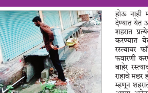
नागरिकांनी कोणते उपाय करावे काय, काळजी घ्यावी या करिता घोष्येरी जाऊन उदा, पाणी टाकी, किंवा पाणी साठवण करण्याच्या सर्व प्रकारच्या जागी अवैधता टाकण्यात येत, आहे जेणेकरून त्या पाण्याच्या पृष्ठभागावर ड्यू सारखे मच्छर,

परळी। प्रतिनिधी परळी शहरामध्ये पावसाळ्याच्या दिवसांत डेंग्यू तापावर प्रतिबंधात्मक उपाययोजना म्हणून नगर परिषद परळीच्या वतीने शहरातील विविध भागात डास प्रतिबंधक औषधाची फवारणी करण्यात येत आहे. परळी वैजनाथ नगर परिषदेच्या वतीने साधरोग प्रतिबंधात्मक उपाय योजना करण्यासाठी डास निर्मूलन मोहीम अंतर्गत डासांचा प्रादुर्भाव होऊ नये म्हणून उपाय योजना नगर परिषद मार्फत करण्यात येत आहेत. नगर परिषदेच्या वतीने खबरदारी म्हणून उपाय योजना स्वच्छता विभागांमार्फत राबविण्यात येत आहेत शहराला स्वच्छ ठेवणे व ड्यू आजारापासून