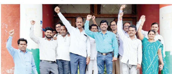
आहे त्यांना रिकाम्या खुर्च्या बघून परतावे लागत आहे व सर्व सामान्य जस्त झाला आहे. महसुल कर्मचाऱ्यांनी आठ दिवसा पासून संप शांततेच्या मागिने सुरू शासन लक्ष देत नसल्याने हे आंदोलन तिंत्रकरण्याचा इशारा महसुल कर्मचारी संघटना तालुका

फिळें धारूर। प्रतिनिधी महसुल कर्मचारी संघटना बेमुदत संप पुकारलेला आहे बेमुदत संपाचा ८ वा दिवस आहे. शासन मागण्या कडे लक्ष देत नसल्याने हा संप तिंत्र करण्याचा इशारा देण्यात आला असून सर्वसामान्यांची तहसील कार्यालयातील कामे मात्र ठप्प झाली आहेत. राज्यातील महसुल कर्मचारी संघटनेने १५ जुलै पासून बेमुदत संप विविध मागण्या साठी पुकारल्याने सर्व कामकाज तहसील कार्यालयाचे ठप्प झाले आहे रोज तहसील कार्यालयात सर्वसामान्य चकरा मारून बेजार