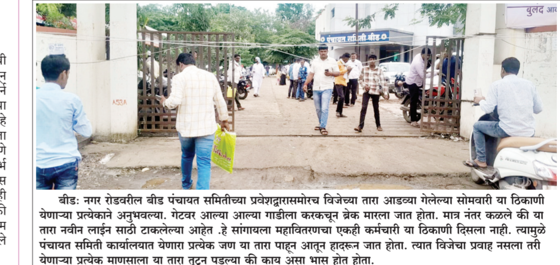
बीड: नगर रोडवरील बीड पंचायत समितीच्या प्रवेशद्वारासमोरचे विजेच्या तारा आडव्या गेलेल्या सोमवारी या ठिकाणी येणाऱ्या प्रत्येकाने अनुभवल्या. गेटवर आल्या आल्या गाडीला करकचून ब्रेक मारला जात होता. मात्र नंतर कळले की या तारा नवीन लाईन साठी टाकलेल्या आहेत. हे सांगायला महावितरणचा एकही कर्मचारी या ठिकाणी दिसला नाही. त्यामुळे पंचायत समिती कार्यालयात येणारा प्रत्येक जण या तारा पाहून आतून हादरून जात होता. त्यात विजेचा प्रवाह नसला तरी येणाऱ्या प्रत्येक माणसाला या तारा तुटून पडल्या की काय असा भास होत होता.