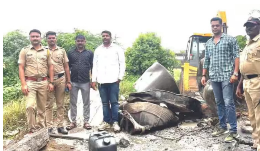
पथक लोणीकंद पोलीस ठाण्याच्या हद्दीत येणाऱ्या अष्टापूर् ग्रामपंचायत हद्दीत राहत असलेल्या

या प्रकरणी पोलिसांनी (झीपश झेथ्रळलश) दिलेल्या आधिक माहितीनुसार, गुन्हे शाखेच्या युनिट ६ चे