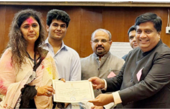
आज मतदान झाले. सायंकाळी निकाल जाहीर झाला. यात पंकजाताई मुंडे पहिल्या पसंतीची मते घेऊन विजयी झाल्या, विजयासाठी २३ मतांचा कोटा असताना त्यांना २६ मते मिळाली. विजयानंतर मुख्यमंत्री एकनाथ शिंदे, उप मुख्यमंत्री देवेंद्र फडणवीस व अजित पवार यांनी त्यांचे अभिनंदन केले.

कार्यकर्त्यांचा जल्लोष ; विधानभवन परिसर गुलालाने न्हाऊन निघाला पंकजाताई मुंडे यांच्या आजच्या विजयाकडे सर्वांचेच लक्ष लागले होते. विजय जाहीर होताच राज्यभरातून आलेल्या कार्यकर्त्यांनी एकच जल्लोष केला. विधानभवन परिसर अक्षरः गुलालाने न्हाऊन निघाला तर विजयाच्या जोरदार घोषणांनी परिसर दणाणून गेला होता. भाजपच्या प्रदेश कार्यालयासमोर पंकजाताईचे स्वागत करण्यासाठी कार्यकर्ते मोठ्या संख्येने जमले होते, पंकजाताईंनी याटिकाणी जाऊन सर्वांचे स्वागत स्वीकारले. यावेळी ढोल ताशांचा निनादत कार्यकर्ते आनंदाने बेभान झाले होते. दरम्यान, परळी शहरात राणी लक्ष्मीबाई टॉवर, छत्रपती शिवाजी महाराज चौक तसेच पंकजाताईंच्या यशःश्री निवासस्थानी कार्यकर्त्यांनी फटाक्यांची आतिषबाजी केली तसेच गुलाल उधळून एकच जल्लोष केला. जिल्ह्यात बीड, आष्टी, पाटोदा, शिरूर, केज, अंबाजोगाई आदीसह विविध ठिकाणी कार्यकर्त्यांनी वाजतगाजत पेढे वाटून आनंद व्यक्त केला.