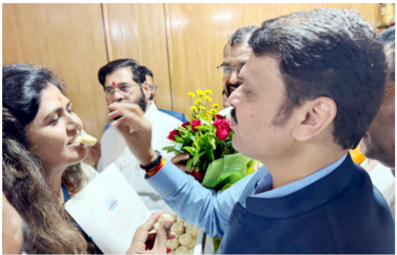
मुंबई। प्रतिनिधी भाजपच्या राष्ट्रीय सचिव पंकजाताई मुंडे यांनी आज विधानपरिषद निवडणुकीत पहिल्या पसंतीची मते घेऊन दणदणीत विजय

विधानभवन परिसर, प्रदेश कार्यालयासमोर कार्यकर्त्यांचा जल्लोष ; ढोल ताशांचा निनाद, गुलालांची उधळण, फटाक्यांची आतिषबाजी ; विजयाच्या घोषणांनी परिसर दणाणला