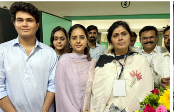
संपादन केला. या विजयानंतर परळीसह जिल्ह्यात अक्षरः आनंदोत्सव साजरा झाला. विधानभवन परिसर आणि भाजप प्रदेश कार्यालया समोर कार्यकर्त्यांनी गुलालाची उधळण, फटाक्यांची आतिषबाजी करत दिवाळी साजरी केली. कार्यकर्त्यांमध्ये प्रचंड मोठा उत्साह यावेळी पहायसाठी मिळाला. विधानपरिषदेच्या अकरा जागांसाठी