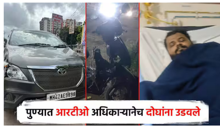
पुण्यात आरटीओ अधिकाऱ्यांचे दोघांना उडवले

पुणे । प्रतिनिधी पुण्यातील अपघातांची मालिका काही गेल्या संपता संपत नाही. कधी बड्या बापांची पोरं सर्वसामान्यांना दारूच्या नशेत उडवतात. तर, कधी प्रशासकीय खुर्चीवर बसलेल्या अधिकाऱ्यांच्या डोक्यातही आपल्या खुर्चीची हवा दिसून येते. कल्याणीनगर येथील पोर्षे कार अपघात प्रकरणात पुणे पोलीस खडबडून जागे झाले आहे. वाहतूक व्यवस्था आणि मद्य पिऊन गाडी चालवणाऱ्यांवर कारवाईचा बडगा उगारला जात आहे. मात्र, एका आरटीओ अधिकाऱ्यांचे दुचाकीला धडक देऊन केल्या अपघातात अद्यापही कारवाई न झाल्याने अपघातातील जखमींकडून संताप व्यक्त होत आहे.