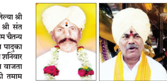
यांचा समाधीपूजन सोहळा होऊन दुपारी दोन ते चार वाजता हा पालखी सोहळा श्री क्षेत्र पंढरपूर कडे रवाना होत आहे सकाळी व दुपारी भोजनाचा कार्यक्रम सांगळे या बंधूंचा होणार आहे. रात्री येथून जवळच असलेल्या निवडुंगा येथे मुक्काम होणार आहे. सात जुलै वाहली. केकान वस्ती. सावरगाव. वनवेवाडी.