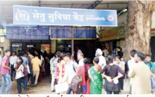
तरी या योजनेचा ऑनलाईन बोजवारा उडाला असल्याचे दिसत असून अर्ज भरायचा कसा ?

शासनाने मोठा गाजावाज करून मुख्यमंत्री माझी लाडकी बहीण ही योजना सुरु केली. दररोज त्यावर चर्चा सुरु असून महिलांमध्ये ही उत्साहाचे वातावरण आहे. महिलांची कागदपत्रे जमा करण्यासाठी सेतु केंद्र, तहसिल कार्यालय, तलाठी कार्यालयावर गर्दी होताना दिसत आहे. मात्र अद्याप योजनेचे पोर्टल अपडेट नाही, नोटिफिकेशन नाही त्यामुळे सध्या