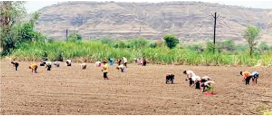
असून गावभर फिरले तरी मजूर मिळत नसल्याचे चित्र आहे. राज्यातील महिलांना

बीड। प्रतिनिधी सध्या या योजनेसाठी लागणारी कागदपत्रे मिळवण्यासाठी ग्रामीण भागातील महिलांची तलाठी आणि तहसीलदार कार्यालय परिसरात मोठी गर्दी आहे. पेरणीच्या दिवसात शेतमजूर महिला कागदपत्रे गोळा करण्यात व्यस्त आहेत. त्यामुळे शेतात महिला मजूर मिळत नसल्याने शेतकरी अडचणीत आले आहेत. सध्या कापूस खुरपणी सुरु असल्याने महिला मजूरांच्या शेतकरी शोधात