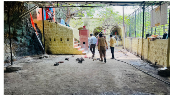
संरक्षित स्मारकाच्या कामासाठी वेगवेगळा कालावधी