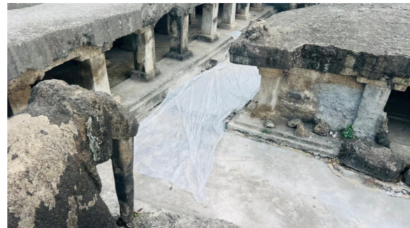
शहरातील ऐतिहासिक वास्तुच्या जतनासाठी शासनाकडे केला पाठपुरावा

राज्याच्या आर्थिक बजेट मध्ये व लोकसभा निवडणुकीची अचारसंहिता लागूपापूर्वीच सदरील कामाची निविदा काढण्यात आली. त्याला मंजूरी देत कार्यरंभ आदेश देण्यात आला. लोकसभेची आचारसंहिता संपुष्टात आल्यानंतर या संरक्षित स्मारकांच्या दुरुस्ती कामाला आता वेग येवू लागला आहे.