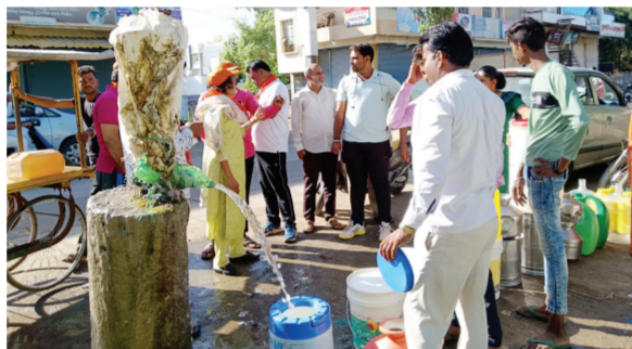
पाणीपुरवठ्यामुळे आमचे अतोनात हाल होत असल्याच्या भावना रिविवासी, नागरिकांनी उपस्थित केल्या.