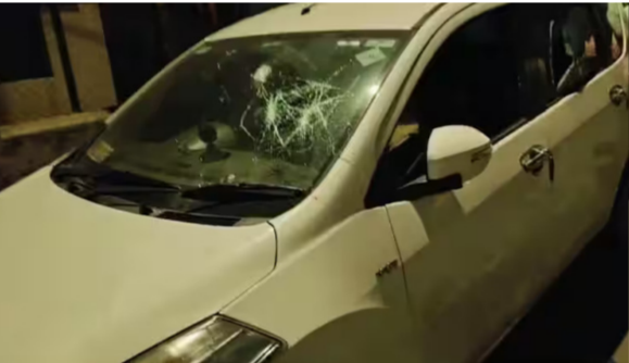
वडगावशेरीत वाहनांची कोयता टोळीने तोडफोड केली आहे.

होत आहे. कालच सिंहगड रस्त्यावरील क्रिकेट वाडी या ठिकाणी कोयता टोळीने धुमाकूळ घालत वाहनांची तोडफोड केली होती. त्यानंतर मध्यरात्री चंद्रनगर परिसरातील कोयता गॅंगची दहशत पहायला मिळाली. पुण्यात कोयता टोळीने पोलिसांच्या गाडीसह १५ ते २० वाहनांची तोडफोड केली. पुण्यातील वडगाव शेरी परिसरातील गणेश नगरमध्ये ही घटना घडली. ६ कार, ४ रिक्शा, ३ टुचकी आणि इतर वाहनांची कोयता गॅंगने तोडफोड केली. गुंडाने धुमाकूळ घालत कोयते आणि दगडांनी वाहनांची तोडफोड केली. या घटनेमुळे परिसरातील नागरिकांमध्ये भीतीचं वातावरण आहे.