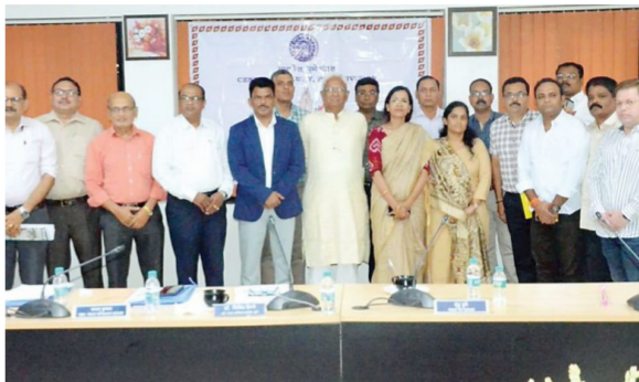
पुणे-मुंबईदरम्यान सकाळी नऊ ते दुपारी तीन वाजण्याच्या दरम्यान आणखी एक नवीन गाडी सुरू करा, कोल्हापूर अहमदाबाद, जोधपूर एक्सप्रेसला कराडला थांबे घ्या, महालक्ष्मी, हार्प्रिया एक्सप्रेस संचे रिक

एलाएचबीमध्ये परिवर्तित करा, पुणे-दौंडपर्यंत इलेक्ट्रिक मेमू सेवा सुरू करा, पुणे-बिकानेर एक्सप्रेसचा कोल्हापूरपर्यंत स्थानकांवर पुरेशा संकेत मार्गदर्शक फलक, सीसीटीव्ही बसवा, यांसारख्या विविध समस्या आणि त्या पूर्ण करण्याच्या मागण्यांचा पाऊस शुक्रवारी (दि. २१) विभागीय रेल्वे सल्लागार समितीच्या बैठकीमध्ये पडला. रेल्वेच्या पुणे विभागातील सल्लागार समितीच्या सदस्यांनी बैठक शुक्रवारी पार पडली. या बैठकीच्या अध्यक्षस्थानी विभागीय रेल्वे व्यवस्थापक