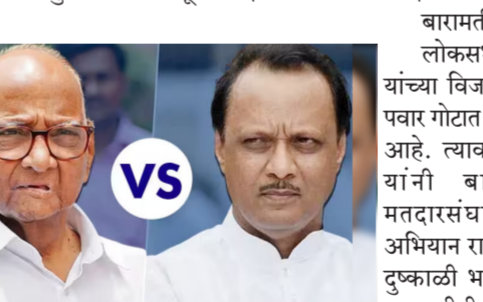
काका विरूद्ध पुण्या नुकतीच पार पडलेली बारामती लोकसभेची निवडणूक लक्षवेधी ठाली. या निवडणुकीची सारी सूत्रे शरद पवार

अजित पवारांच्या वर्चस्वाला अखेरचा सुरंग लावण्याचे शरद पवारांचे मनसुबे सुटून निघण्याची चिन्हे बारामती मतदारसंघातून राष्ट्रवादी काँग्रेस शरदचंद्र पवार पक्षाच्या सुप्रिया सुळे यांनी १ लाख ५८ हजार मतांच्या फरकाने विजय मिळविला. या निवडणुकीत बारामती विधानसभा मतदारसंघाने सुळे यांना ४८ हजार मतांची आघाडी दिली. आता या आघाडीच्या जोरावरच विधानसभेला उपमुख्यमंत्री अजित पवार यांच्या बारामतीतील वर्चस्वाला अखेरचा सुरंग लावण्याचे काम सुरूच नेते खा. शरद पवार यांनी मतदारांचे आभार मानण्यासाठी तीन दिवस बारामती तालुक्याचा दौरा करून घेऊन केल्याचे दिसते. ठिकठिकाणी सभा घेऊन, शेतकऱ्यांशी संवाद साधत, जुन्या सहकार्यांच्या घरी भेट देत शरद पवार यांनी आगामी विधानसभा निवडणुकीच्या दृष्टीनेच पेपणी केल्याची चर्चा राजकीय वर्तुळात आहे.