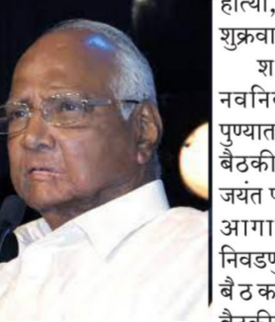
शरद पवार यांनी विधानसभेसाठी व्यूहरचना सुरु केली आहे. लोकसभेत राष्ट्रवादी काँग्रेसला जास्त जागा मिळाल्या हव्या होत्या, असे शरद पवार यांनी शुक्रवारी म्हटले आहे.

पुणे । प्रतिनिधी लोकसभा निवडणुकीत महाविकास आघाडीला चांगले यश मिळाले. या यशात सर्वाधिक वाटा राष्ट्रवादी काँग्रेस शरदचंद्र पवार पक्षाचा आहे. शरद पवार यांचा स्ट्राईक रेट महाविकास आघाडीत सर्वाधिक आहे. शिवसेना उभाठाकडून सर्वाधिक २१ जागेवर उमेदवार उभे करण्यात आले होते. काँग्रेसकडून १७ तर राष्ट्रवादी काँग्रेस (शरदचंद्र पवार) गटाकडून दहा जागांवर उमेदवार उभे करण्यात आले होते. त्यात काँग्रेसला १३, शिवसेनेला १ तर शरद पवार यांच्या राष्ट्रवादीला दहा पैकी ८ जागांवर विजय मिळाला. त्यामुळे आता