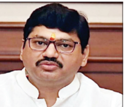
पान २ वर