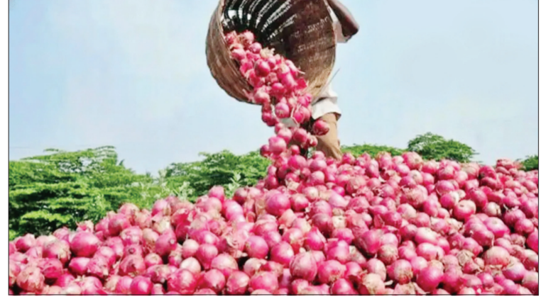
याच कांदा प्रश्नामुळे लोकसभा निवडणुकीत देखील महायुतीला फटका बसला होता. केंद्र सरकारकडून नाफेड आणि पान २ वर