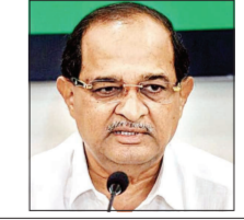
पान २ वर

मुंबई। प्रतिनिधी राज्यातील अनेक भागात पावसाचे आमनन झाले असले, तरी अनेक विभागात अद्यापही समाधानकारक पाऊस झालेला नाही. त्यामुळे राज्यातील १२४५ महमुली मंडळात चारा डेपो उभारण्यास शासनाने परवानगी दिल्याची माहिती राज्याचे महसूल तथा पशुसंवर्धन, दुग्ध व्यवसाय विकास मंत्री राधाकृष्ण विखे पाटील यांनी दिली. या निर्णयामुळे शेतकऱ्यांना मोठा दिलासा मिळणार आहे. जून महिन्याच्या पहिल्याच आठवड्यापासून राज्यात विविध ठिकाणी पावसाला सुरुवात झाली आहे. पान २ वर