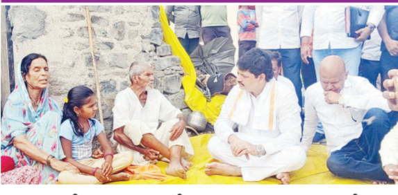
आपला जीव गमवावा, ही आमच्या मनात अपराधीपणाची भावना उत्पन्न करणारी बाब आहे. पान २ वर