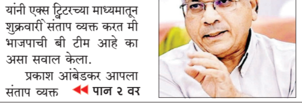
पान २ वर

मुंबई। प्रतिनिधी राज्यातील अनेक भागात पावसाचे आमनन झाले असले, तरी अनेक विभागात अद्यापही समाधानकारक पाऊस झालेला नाही. त्यामुळे राज्यातील १२४५ महमुली मंडळात चारा डेपो उभारण्यास शासनाने परवानगी दिल्याची माहिती राज्याचे महसूल तथा पशुसंवर्धन, दुग्ध व्यवसाय विकास मंत्री राधाकृष्ण विखे पाटील यांनी दिली. या निर्णयामुळे शेतकऱ्यांना मोठा दिलासा मिळणार आहे. जून महिन्याच्या पहिल्याच आठवड्यापासून राज्यात विविध ठिकाणी पावसाला सुरुवात झाली आहे. पान २ वर