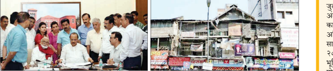
पान २ वर

पुणे। प्रतिनिधी महात्मा फुले आणि क्रांतिज्योती सावित्रीबाई फुले यांनी पुण्यातील भिडेवाड्यात सुरू केलेल्या मुलींच्या पहिल्या शाळेत क्रांतिज्योती सावित्रीबाई फुले यांचे राष्ट्रीय स्मारक उभारण्याच्या दृष्टीने आवश्यक ती प्रक्रिया करून गतीने निविदा प्रक्रिया राबविण्यात येणार आहे. या स्मारकाच्या कामाचे भूमिपूजन जुलैमध्ये होणार आहे. या स्मारकाचा आराखडा तयार होणार नाही. पण तेथे ठिकाणी शाळा होणार नाही. पण तेथे मुलीसाठी वेगवेगळे अभ्यासक्रम सुरू केले जातील, असे उपमुख्यमंत्री अजित पवार पान २ वर