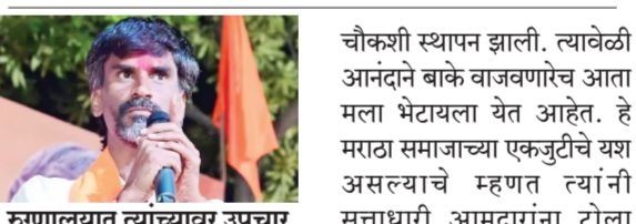
रुग्णालयात त्यांच्यावर उपचार सुरू आहेत. शुक्रवारी (दि. १४) ते पत्रकार परिषदेत बोलत होते. सभागृहात मराठा आंदोलनावर एसआयटी चौकशी स्थान झाली. त्यावेळी आनंदाने बाके वाजवणारेच आता मला भेटायला येत आहेत. हे मराठा समाजाच्या एकजूतीचे यश असल्याचे म्हणत त्यांनी सत्ताधारी आमदारांना टोला लगावला. तसेच आता पुढील एक महिन्याच्या आत आरक्षण मिळाले नाही. तर संपूर्ण समाज रस्त्यावर. पान २ वर

छ. संभाजीनगरे। प्रतिनिधी राज्याचे उपमुख्यमंत्री व गृहमंत्री देवेंद्र फडणवीस यांचा फोन आला होता. त्यांनी एसआयटी चौकशी रद्द करण्याचे आश्वासन दिले आहे. मात्र, खरंच तसे होईल का? की त्यांनी केवळ श्रेंगा हाणल्या, हे लवकरच कळेल, अशा शब्दांत मराठा आरक्षणाचे नेते मनोज जरांगे यांनी फडणवीसांच्या कार्यपद्धतीवर संशय व्यक्त केला. गुरुवारी उपोषण मागे घेतल्यानंतर शहरातील खासगी