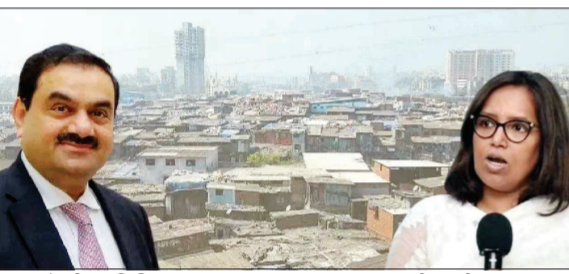
मुंबई। प्रतिनिधी भारतीय जनता पक्षाचे सरकार अदानींवर मेहरबान असून अदानींसाठीच सत्ता राबवली जात असल्याचे पुन्हा पुन्हा स्पष्ट होत आहे. धारावी पुनर्वसन प्रकल्पाच्या नावाखाली सरकारने सर्व नियम, कायदे, अटी ह्या अदानींचा फायदा

● शासनाचा जिआर निघाला; काँग्रेसचा गंभीर आरोप