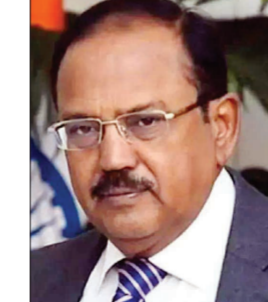
अजित डोवाल सलग तिसऱ्यांदा राष्ट्रीय सुरक्षा सल्लागारपदी

मंत्रिमंडळाच्या नियुक्ती समितीने डॉ. पी.के. यांच्या नियुक्तीला मान्यता दिली आहे. त्यामुळे सेवानिवृत्त अधिकारी डॉ. पी.के. मिश्रा हे सोमवार १० जून २०२४ पासून पंतप्रधानांचे प्रधान सचिव म्हणून कार्यरत आहेत. त्यांची नियुक्ती पंतप्रधानांच्या कार्यकाळासह किंवा पुढील आदेश येईपर्यंत यापैकी जे आधी असेल ते सह-टर्मिनस असेल. त्यांच्या पदाच्या कार्यकाळात,