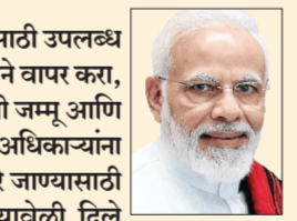
पंतप्रधान मोदींनी घेतला जम्मू - काश्मीरच्या सुरक्षा स्थितीचा आढावा

जम्मू-काश्मीरमध्ये गेल्या काही दिवसांपासून दहशतवादी हल्ले वाढले आहेत. या पार्श्वभूमीवर ह्या बैठकीचे आयोजन करण्यात आले होते. या आढावा बैठकीसाठी राष्ट्रीय सुरक्षा सल्लागार अजित डोवाल आणि इतर वरिष्ठ अधिकारी