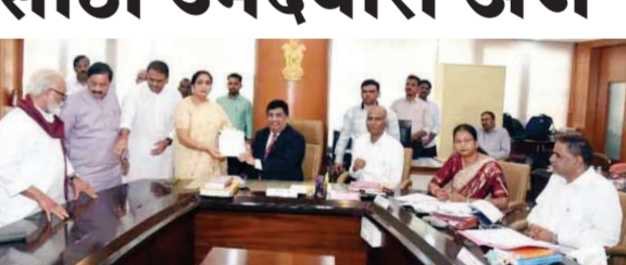
साडेचार वर्षे शिल्लक असताना यापूर्वी आपल्या पदाचा राजीनामा दिला. त्यानंतर प्रफुल पटेल यांनी पुन्हा राज्यसभेसाठी

सुनेत्रा पवार यांच्याकडे पाहिले जात असताना मात्र महायुतीचे तथा भाजपा नेते देवेंद्र फडणवीस आणि शिवसेना शिंदे गटच्या नेत्यांपैकी एकही नेता यावेळी उपस्थित नव्हता. राज्यसभा खासदार असलेल्या प्रफुल पटेल यांनी त्यांच्या पदाची आणखी