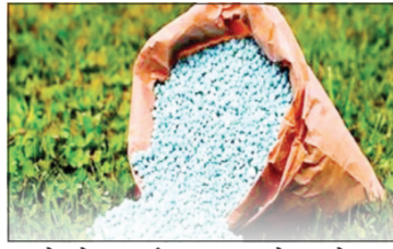
आहे. शेतकऱ्यांना अशाप्रकारे लुटले जात असताना कृषी खाते झोपा काढत आहे का? असा सवाल संभाजीराजेंनी केला

कार्यवाही केली पाहिजे असे मत स्वराज्य पक्षाचे प्रमुख संभाजीराजे छत्रपती यांनी व्यक्त केले. राज्यात मोठ्या प्रमाणावर शेतकऱ्यांची लूट सुरू असताना कृषीमंत्र्यांनी प्राडवर येऊन काम करणे अपेक्षित आहे. मात्र, हे कृषीमंत्री व्हाईटसअॅपवर, फेसबुकद्वारे जाहीर करून ऑनलाईन तक्रारी मागवत असल्याचे म्हणत संभाजीराजेंनी धनंजय मुंडेवर टीका केली. २६६ रुपयांची खताची गोणी ८०० रुपयांना दिली जात