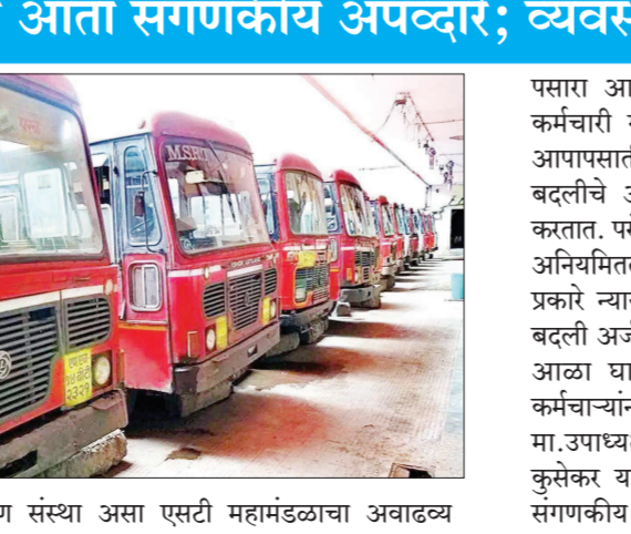
प्रशिक्षण संस्था असा एसटी महामंडळाचा अवाढव्य

एसटी महामंडळामध्ये चालक-वाहकापासून अधिकाऱ्यांपर्यंत सुमारे ८७ हजार कर्मचारी संख्या कार्यरत आहेत. एक मध्यवर्ती कार्यालय, सहा प्रदेश, त्या प्रदेशांतर्गत ३१ विभाग आणि या विभागांतर्गत कार्यरत असलेले २५१ आगार. या बरोबरच तीन मध्यवर्ती कार्यशाळा, ९ टावर पुनर्ररण प्रकल्प आणि एक मध्यवर्ती