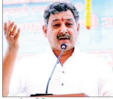
पुणे। प्रतिनिधी राज्यात अनेक भागांमध्ये खते वी-बियाणांमध्ये शेतकऱ्यांची लूट, फसवणूक सुरू आहे. याबाबत राज्य सरकारने तातडीने