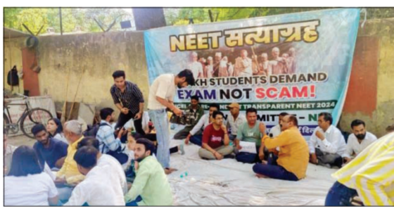
राष्ट्रीय चाणगी संस्थेची (एनटीए) सीबीआय चौकशी करावी. तसेच संपूर्ण नीट परीक्षा पुन्हा घेण्यात यावी, अशी आंदोलकांची मागणी आहे. नीट परीक्षा

नवी दिल्ली। वृत्तसंस्था गोंधळ परिस्थितीच्या विरोधात गुरुवारी (दि. १३) विद्यार्थी, पालक आणि वेगवेगळ्या विद्यार्थी संघटनांनी दिल्लीतील जंतर मंतरवर 'नीट सत्याग्रह आंदोलन' सुरू केले आहे. न्यायालयाने ग्रेस मार्क रद्द केल्यानंतर ही परीक्षा रद्द करून नव्याने परीक्षा घेण्याची मागणी आंदोलनकर्त्यांची आहे.