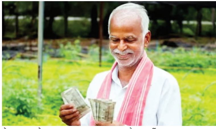
केला जात आहे.

राज्यात जूनच्या सुरुवातीला चांगला पाऊस झाला असून अनेक ठिकाणी पेरण्या सुरु झाल्या आहेत. पेरण्या करण्यासाठी बी-बियाणे, खते खरेदी करण्यासाठी भरमसाठ पैसा लागत असताना राज्यातील बँका मात्र पिककर्ज देण्यामध्ये कंजूसी करित असल्याचे समोर आले आहे. बीड जिल्ह्यासाठी खरीप पिकासाठी एक हजार सातशे सात कोटी रुपये पिक कर्ज वाटपाचे उद्दिष्ट आहे. मात्र दिनांक १० जून पर्यंत केवळ तिनशे बावीस कोटी रुपये पिक कर्ज वाटप झाले आहे. त्यामुळे शेतकऱ्यांना पिक कर्ज कोण देणार आणि कधी देणार? असा प्रश्न सध्या उपस्थित