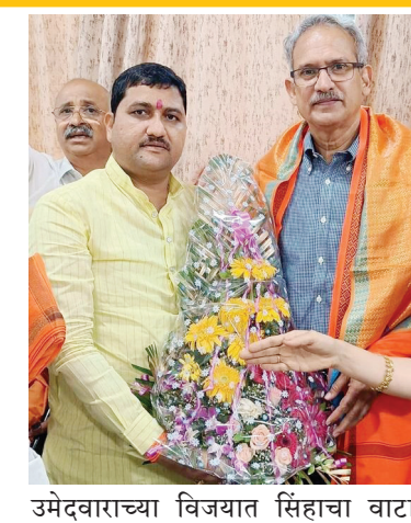
उमेदवारांच्या विजयात सिंहाचा वाटा

लोकसभा निवडणुकीत ठाकरे शिवसेनेला ९ जागा मिळाल्या. जागा मतदार संघात मित्रपक्षांचे उमेदवार होते. त्याठिकाणी शिवसेनेच्या जिल्हाप्रमुखांनी संबंधीत