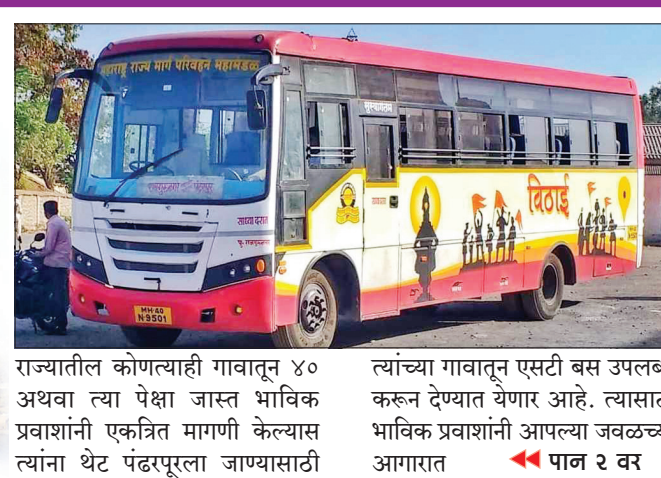
राज्यातील कोणत्याही गावातून ४० अथवा त्या पेक्षा जास्त भाविक प्रवाशांनी एकत्रित मागणी केल्यास त्यांना थेट पंढरपूरला जाण्यासाठी