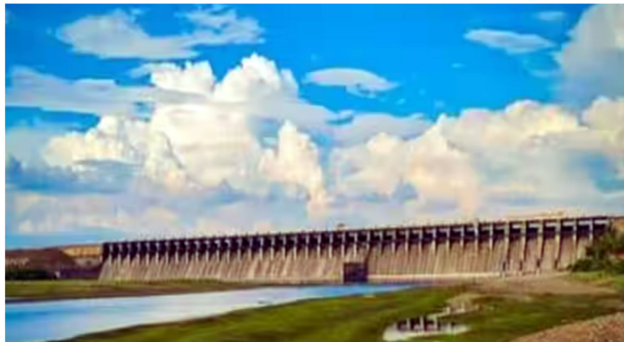
प्रशासन आणि बळीराजाची चिंता वाढली होती. यातच नीचांकी पातळीमुळे उजनीवरील सर्व योजना

धरणात जवळपास १ टीएमसी पाण्याची वाढ यंदाच्या भीषण दुष्काळी स्थितीमुळे उजनी धरण ४४ वर्षांच्या नीचांकी पातळीला गेले होते. एका बाजूला चिंता वाढत चाललेली असताना गेल्या तीन ते चार दिवसापासून सुरु झालेल्या पावसामुळे धरणात जवळपास १ टीएमसी पाण्याची वाढ झाली आहे. यंदा उजनीने सर्वात नीचांकी म्हणजे वजा ५९.९९ टक्के पातळी गाठल्याने