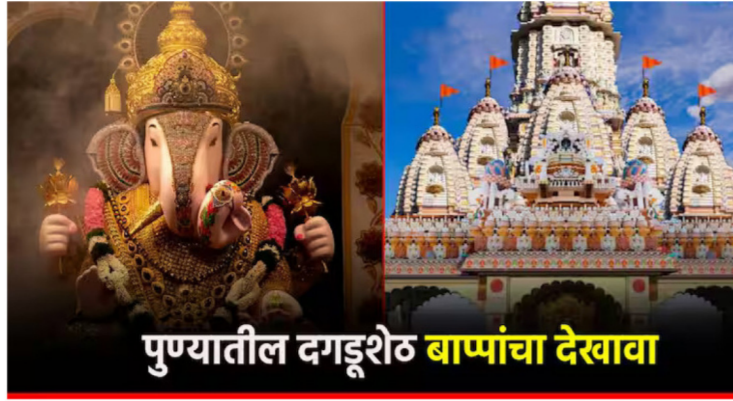
पुण्यातील दगडूशेठ बाप्पांचा देखावा