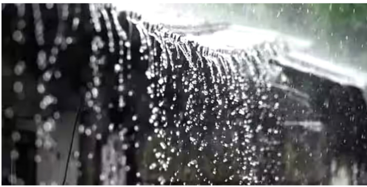
मान्सून राज्याच्या इतर भागातही सक्रिय होईल.

आज 'या' भागात जोरदार पावसाची शक्यता : आज कोकणासह मध्य महाराष्ट्र आणि विदर्भात पावसाचा यलो अलर्ट जारी