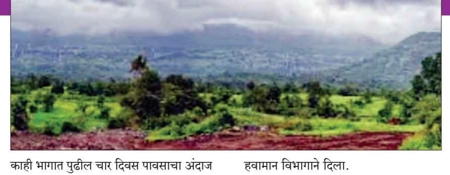
काही भागात पुढील चार दिवस पावसाचा अंदाज हवामान विभागाने दिला.

जिल्हाच्या काही भागात तो दाखल झाला. कर्नाटक, तेलंगणा, किनारी आंध्र प्रदेशच्या आणखी काही भागात मान्सूनने प्रगती केली. अरबी समुद्राचा आणखी काही भाग तसेच बंगालच्या उपसागरात बहुतांशी भागात मान्सून पोहचला. मान्सूनची सिमा रत्नागिरी, सोलापूर, मेडक, भद्राचलम, विजयनगरम भागात होती. मान्सूनच्या वाटचालीसाठी पोषक हवामान आहे. त्यामुळे पुढील ३ ते ४ दिवसांमध्ये मान्सून