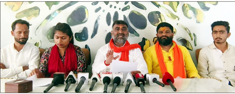
शिवशाहीरांचा.. स्वराज्याच्या इतिहासाचा' व 'सोहळा पालखीचा, स्वराज्याच्या ऐक्याचा' कार्यक्रम शिवराज्याभिषेक महोत्सवाचे आकर्षण

समितीने दुर्गराज रायगडावर ५ व ६ जून २०२४ रोजी शिवराज्याभिषेक सोहळा समितीचे मार्गदर्शक युवराज संभाजी छत्रपती महाराज व युवराजकुमार शहाजीराजे छत्रपती यांच्या प्रमुख उपस्थितीत साजरा होत आहे. यंदा 'धार तलवारीची, युद्धकला महाराष्ट्राची', 'जागर