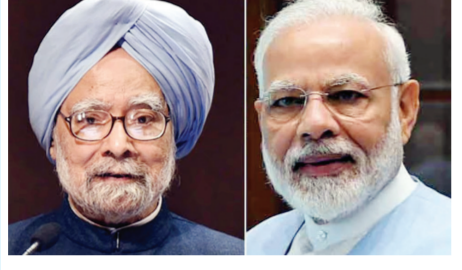
नवी दिल्ली। वृत्तसंस्था देशाचे माजी पंतप्रधान डॉ. मनमोहन सिंग यांनी विद्यमान नरेंद्र मोदी सरकारची मागील १० वर्षांतील कामगिरी निराशाजनक राहिल्याचे मत व्यक्त केले. तसेच केंद्र सरकारच्या शेती धोरणावरूनही डॉ.सिंग यांनी नाराजी व्यक्त केली आहे. शेतकरी आंदोलन,

दुप्पट उत्पन्न यावरही टिपणी केली. लोकसभा निवडणुकांच्या शेवटच्या टप्प्यासाठी १ जून रोजी मतदान होत आहे. या पार्श्वभूमीवर डॉ. सिंग यांनी पंजाबच्या नागरिकांना पत्र लिहिले आहे. या पत्रात देशातील लोकशाही, संविधान सुरक्षित ठेवण्यासाठी निरंकुश सत्ताधाऱ्यांना पायउतार करण्याचे आवाहन डॉ. सिंग यांनी मतदारांना केले आहे. डॉ. सिंग यांनी तीन कृषी कायद्यांच्या विरोधात शेतकऱ्यांनी केलेल्या आंदोलनाबद्दल पत्रात भाष्य केले आहे. त्यासोबतच भाजपने शेतकऱ्यांची