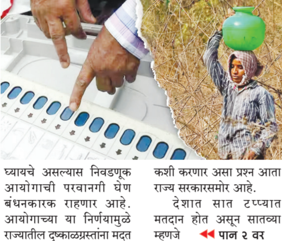
ध्यायचे असल्यास निवडणूक आयोगाची परवानगी घेणे बंधनकारक राहणार आहे. आयोगाच्या या निर्णयामुळे राज्यातील दुष्काळग्रस्तांना मदत कशी करणार असा प्रश्न आता राज्य सरकारसमोर आहे. देशात सात टप्प्यात मतदान होत असून सातव्या म्हणजे २२ पान २ वर

मुंबई। प्रतिनिधी जोपर्यंत नवीन लोकसभा स्थापन होत नाही तोपर्यंत आचारसंहितेमध्ये स्थितिलता दिली जाणार नाही अशी महत्त्वपूर्ण माहिती राज्य निवडणूक आयोगाने दिली आहे. ४ जून रोजी मतमोजणी झाल्यानंतर लोकसभा स्थापन होईल आणि त्यानंतर आचारसंहितेमध्ये स्थितिलता दिली जाईल असे आयोगाने स्पष्ट केले आहे. त्यामुळे अन्यायवश्यक काही घोषणा किंवा निर्णय राज्य सरकारला