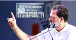
स्वतः उपस्थित राहतात की वकिलांमार्फत बाजू मांडतात हे पहावे लागेल.

मुंबई। प्रतिनिधी स्वातंत्र्यवीर सावरकर यांच्याबाबत लंडनमध्ये केलेले वक्तव्य काँग्रेस नेते राहुल गांधी यांना भोवण्याची शक्यता आहे. स्वातंत्र्यवीर सावरकर बदनामी प्रकरणी काँग्रेस नेते राहुल गांधींना १९ ऑगस्ट रोजी प्रत्यक्ष न्यायालयात हजर राहण्याचे आदेश पुण्यातील सत्र न्यायालयाने दिले आहेत. कलम २०४ अन्वये हे आदेश देण्यात आले आहेत. राहुल गांधींनी मार्च २०२३ मध्ये लंडन येथील भाषणात केलेल्या वक्तव्याच्या विरोधात त्यांच्या विरोधात हा खटला दाखल करण्यात आला होता. आता राहुल गांधी न्यायालयाच्या या आदेशानंतर