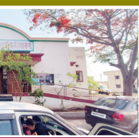
प्रसुतीसाठी येणाऱ्या रुग्णांचे संदर्भित (रेफर) चे प्रमाण अधिक

किळे धारूर । प्रतिनिधी तालुक्यातील रुग्णांची सोय व्हावी म्हणून धारूर येथे सुसज्ज अशी ग्रामीण रुग्णालयाची इमारत उभारलेली आहे मात्र या रुग्णालयात सध्या सावळा गोंधळ सुरू असून रुग्णांच्या जीवाशी खेळले जात आहे अक्षरशः शालेय आरोग्य अधिकारी व आयुष्य चे डॉक्टर धारूर येथील ग्रामीण रुग्णालय चालवत आहेत त्यामुळे रुग्णांची मोठी गैरसोय होताना दिसून येत आहे धारूर तालुका हा ऊसतोड मजुरांचा तालुका म्हणून ओळखला जातो ग्रामीण भाग असल्याने मोठ्या प्रमाणावर रुग्ण हे ग्रामीण रुग्णालयात रुग्णसेवा घ्यायला येतात यासाठी शासनाच्या वतीने