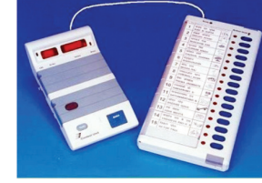
देशात १० राज्यांतील ९६ मतदारसंघात १३ मे रोजी मतदान पार पडत आहे. या चौथ्या टप्प्यात राज्यातील नंदुरबार, जळगाव, रावोंर, जालना, छत्रपती संभाजीनगर, पान २ वर

मुंबई । प्रतिनिधी लोकसभा निवडणुकीच्या राज्यातील चौथ्या टप्प्यात ११ लोकसभा मतदारसंघांत १३ मे रोजी मतदान होणार असल्याने या मतदारसंघांतील प्रचार तोफा शनिवारी संध्याकाळी थंडावल्या. आता राहिलेल्या एक दिवसात भेटीगाठींवर भर दिला जाणार आहे. महाराष्ट्रातील पश्चिम महाराष्ट्र, उत्तर महाराष्ट्र, मराठवाडा व कोकणातील काही मतदारसंघांचा या टप्प्यात समावेश आहे. दरम्यान, या चौथ्या टप्प्यात