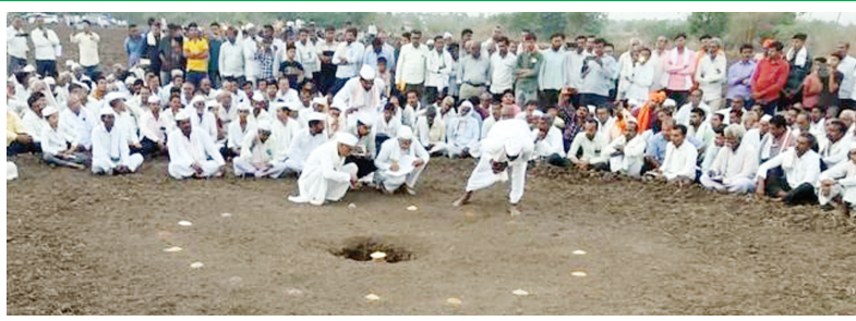
अंदाजानंतर आता भेंडवळची घटमांडणीमध्ये देखील यंदाच्या वर्षी चांगला पाऊस पडणार असल्याचे भाकीत करण्यात आले आहे.

बुलढाणा । प्रतिनिधी राज्यात सध्या सर्वच शेतकऱ्यांना मान्सूनच्या पावसाचे वेध लागले आहेत. परिणामी, राज्यात सर्वदूर सध्या शेतीची मशागतीची कामे उरकताना दिसून येत आहेत. अशातच आता यंदाच्या मान्सूनच्या पावसाबाबत मोठी अपडेट समोर आली आहे. विदर्भातील जवळपास ३५० वर्षांपासूनची जुनी परंपरा म्हणजे बुलढाणा जिल्ह्यातील भेंडवळची घटमांडणी होय. भारतीय हवामानशास्त्र विभागाच्या (आयएमडी) यंदाच्या वर्षांच्या चांगल्या पावसाच्या