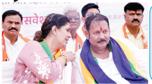
मराठवाड्याच्या विकासासाठी पंकजाताई आवश्यक- उपमुख्यमंत्री अजित पवार

आष्टी/कडा/परळी । प्रतिनिधी लोकसभेच्या चौथ्या टप्प्यातील प्रचाराच्या तोफा शनिवारी सायंकाळी ६ वा. थंडावल्या. भाजपच्या उमेदवार पंकजाताई मुंडे यांच्यासाठी छत्रपती उदयनराजे भोसले यांनी तीन ठिकाणी सभा घेतल्या. त्यामुळे बीड जिल्ह्यातील राजकीय वातावरण फिरले असून उदयनराजेच्या रुपाने छत्रपतींचा आशिर्वाद पंकजाताईला मिळाला असल्याचे म्हटले जात आहे. तर उपमुख्यमंत्री अजित पवार यांनी कडा येथे सभेला उपस्थित राहून बजरंग सोनवणेवर हल्लाबोल करीत वातावरण फिरवले. दुसरीकडे शरद पवार यांनी महाविकास आघाडीचे उमेदवार बजरंग सोनवणे यांच्यासाठी बीड जिल्ह्यात तीन मुक्काम केले. त्यामुळे सोनवणेसाठी पवारांनी बळ लावल्याचे दिसते.