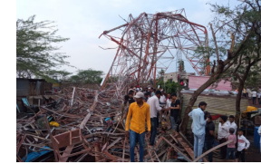
एकाच कुटुंबातील तीन बालकांसह दोन गंभीर जखमी

किळे धारूर । प्रतिनिधी धारूर शहरात पुन्हा अवकाळी कहर शहराच्या पश्चिम बाजूस असणाऱ्या झोपडपट्टी भागात बीएसएनएलचे कार्यालय व त्या ठिकाणी बीएसएनएल चे टॉवर आहे हे टॉवर आज झालेल्या अवकाळी पावसामुळे कोलमडले भागात राहणाऱ्या तीन लहान मुले व दोन मोठी माणसे राहत असलेल्या घरावर कोसळला नागरिकांना गंभीर दुखापत झाली. या भागात राहणाऱ्या नागरिकांना बाहेर काढले. दिवसापासून