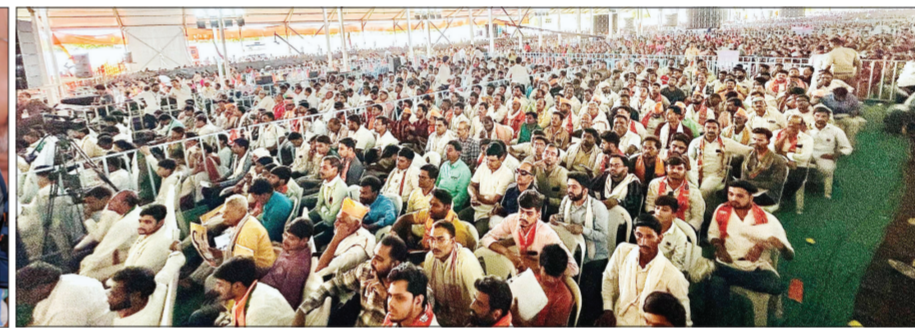
पंतप्रधान नरेंद्र मोदी यांनी आज येथे केले. भाजप महायुतीच्या बीड लोकसभेच्या