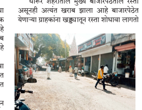
धारूर शहरातील मुख्य बाजारपेठेतील रस्ता असूनही अत्यंत खराब झाला आहे बाजारपेठेत येणाऱ्या ग्राहकांना खड्ड्यातून रस्ता शोधवा लागतो त्यामुळे ग्राहकांना नाहक त्रास सहन करावा लागतो. नगरपरिषदेने हा रस्ता लवकरात लवकर दुरुस्त करून व्यापारी व नागरिकांची अडचण सोडवावीयासाठी.

धारूर। प्रतिनिधी धारूर शहरातील मुख्य बाजारपेठ असणाऱ्या छत्रपती शिवाजी महाराज चौक ते काशिनाथ चौक या परिसरामध्ये शहरातील मुख्य बाजार पेठ आहे नेहमीच वरदळीचा असणारा रस्ता पूर्ण खराब झाला आहे रस्त्यावर जागोजागी खड्डे पडले आहे त्यामुळे बाजारपेठेत येणाऱ्या वाहनधारकांना खड्डे चुकवत मार्ग काढावा लागतो. धारूर शहरातील मुख्य बाजारपेठेत नागरिकांना व वाहनधारकांना रस्ता शोधताना कसरत करावी लागते रस्त्यावरील खड्ड्यांमध्ये मुरूम कचकडी टाकून काम केले जाते परत आठ दिवसांमध्ये रस्त्यावरील खड्डे उघडे पडतात त्यामुळे अपघात होऊ शकतात. पावसाळ्यामध्ये जर खड्ड्यांमध्ये पाणी जमा झाल्यास तस्त्याचे स्वरूप येऊ शकते पावसाळ्या आधीच रस्त्याची दुरुस्ती व्हावी अशी शहरातील मुख्य बाजारपेठेतील व्यापाऱ्यांची अपेक्षा आहे.