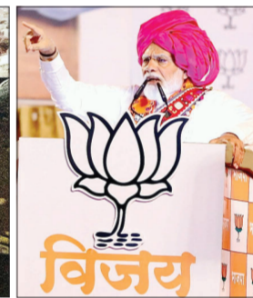
उमेदवार पंकजाताई मुंडे यांच्या प्रचारार्थ आज कृषी महाविद्यालयाच्या विस्तीर्ण

मैदानावर पंतप्रधान नरेंद्रजी मोदी यांची जाहीर सभा झाली. यावेळी च्यासपीठावर