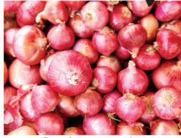
प्रश्न उपस्थित केला जात आहे. रबी खरेदी पीएसएफ-२०२४ साठी

प्राप्त्याने नाफेडकडून २.५ लाख टन आणि एनसीसीएफसाठी २.५ लाख टन कांदा खरेदी केला जाणार आहे. असेही त्यांनी म्हटले आहे. तर खरेदी केंद्राला अजूनही परवाने मिळाले नसल्याने खरंच केंद्र सरकार ५ लाख टन कांदा खरेदी करणार आहे का? असा