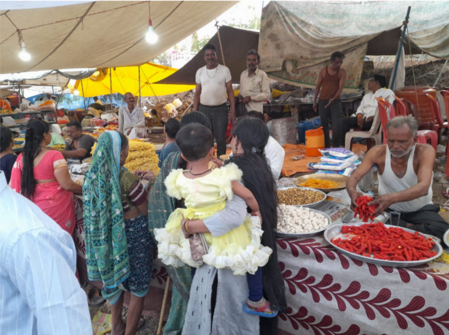
पिंपळवडी: येथून जवळच असलेल्या पांगरी (मारुतीची) येथील हनुमंत देवताची यात्रा प्रतिवर्षाप्रमाणे मोठ्या जल्लोषात साजरी झाली.यात्रेला पंचक्रोशीतील पुरुष-महिला,युवक-मुलीनी गर्दी करून यात्रेचा आनंद घेतला.यात्रेत खेळणी तसेच मिठाईचे स्टॉल मोठ्या प्रमाणात थाटली होती.