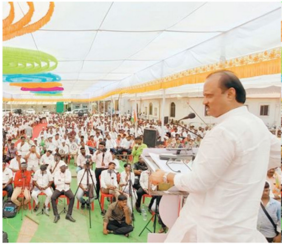
होते. अजित पवार म्हणाले, माजी मंत्री हर्षवर्धन पाटील, आमदार दत्तात्रय भरणे व मी राज्याच्या व इंदापूर तालुक्याच्या

इंदापूर । प्रतिनिधी मागील दहा वर्षांपासून लोकांसमोर आणखी एक खासदाराने काम केलेले नसून, केवळ मसेलफीफ काढण्याचे काम केले आहे, असा टोला उपमुख्यमंत्री अजित पवार यांनी त्यांच्या भगिनी तसेच महाविकास आघाडीच्या बारामती लोकांसमोर मतदारसंघाच्या उमेदवार सुप्रिया सुळे यांना नाव न घेता लगावला. इंदापूर तालुक्याच्या शेळगाव येथे महायुतीच्या बारामती मतदारसंघाच्या उमेदवार सुनेत्रा पवार यांच्या प्रचारार्थ सभा पार पडली, त्यासभेत पवार बोलत