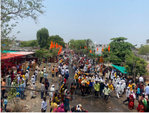
करून उपवास धरतात व विविध सांस्कृतिक कार्यक्रमाचे आयोजन केले जाते यामध्ये किर्तन , भारूड, आरादी मेळा ,गोंधळी कला अशा विविध कार्यक्रमांचे आयोजन करतात.या यात्रेत गाड्या ओढण्याची प्रथा गेली ६० वर्षापासून सुरु आहे.चैत्र पौर्णिमेच्या दिवशी गाड्या ओढण्यासाठी गावातील