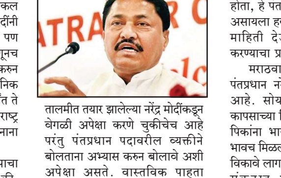
तालमीत तयार झालेल्या नरेंद्र मोदींकडून वेगळी अपेक्षा करणे चुकीचेच आहे परंतु पंतप्रधान पदावरील व्यक्तीने बोलताना अभ्यास करून बोलावे अशी अपेक्षा असते. वास्तविक पाहता स्वातंत्र्य चळवळीत भाजपा, जनसंघ अथवा राष्ट्रीय स्वयंसेवक संघाचे काहीही योगदान नाही. नरेंद्र मोदी ज्या विचारधारेचे प्रतिनिधित्व करतात तेच लोक मुस्लीम लीगबरोबर सरकारमध्ये सहभाग्य होते आणि त्याच परिवारातील

मुंबई । प्रतिनिधी मोदी सरकार घरात घुसून सर्जिकल स्ट्राईक करते असे पंतप्रधान नरेंद्र मोदींनी परभणीच्या प्रचार सभेत सांगितले. पण नरेंद्र मोदी चीनला याबद्दल म्हणूनच चीनने भारताच्या सीमेत घुसखोरी करून जमीन बळकावली, आपले २० सैनिक मारले तरीही नरेंद्र मोदींना आजपर्यंत ते कसे दिसले नाही, असा प्रश्न महाराष्ट्र प्रदेश काँग्रेस कमिटीचे अध्यक्ष नाना पटोले यांनी विचारला आहे. पंतप्रधान नरेंद्र मोदी व भाजपाचा समाचार घेत नाना पटोले म्हणाले की, नरेंद्र मोदींनी आज पुन्हा एकदा देशाच्या विभाजनाचा मुद्दा उपस्थित करून जनतेची दिशाभूल करण्याचा प्रयत्न केला. विभाजनाला काँग्रेस जबाबदार असल्याचा मोदींचा आरोप धांदात खोटा आहे. आएसएसच्या खोटे बोलण्याच्या