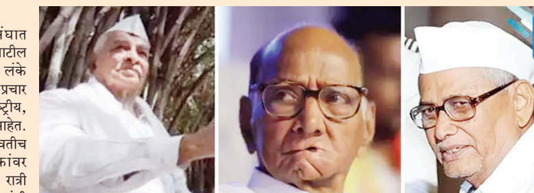
मदत केली होती हे मात्र विसरतात. विखे परिवार माणुसकी नाही. परंतु त्यांच्या परिवाराच्या सार्वजनिक जीवनात आमची काही ना काही मदत त्यांना नक्कीच झालेली आहे. पूर्वी एकदा बाळासाहेब विखे खासदारकीला उभे असताना मी त्यावेळी मुख्यमंत्री होते. भाऊसाहेब थोरात मदत करतील अशी बाळासाहेब विखे यांना खात्री नव्हती. त्यावेळी मी नगर जिल्हाच्या दीनार यांच्याची माफी मागितली व थोरात यांनीही त्यांना माफ केले.

अहमदनगर । प्रतिनिधी अहमदनगर लोकसभा मतदारसंघात महायुतीचे खासदार डॉ. सुजय विखे पाटील आणि महाविकास आघाडीचे नीलेश लंके यांच्यात लढत होत आहे. दोघांचाही प्रचार जोरात सुरू आहे. मात्र, प्रचारार राष्ट्रिय, राज्यपेक्षा स्थानिक मुद्दे अधिक चर्चेत आहेत. प्रचार विखे पाटील आणि लंके यांच्याभोवतीच फिरत आहे. दोन्ही बाजूंनी एकमेकांवर आरोपप्रत्यारोप सुरू आहेत. शुक्रवारी रात्री राष्ट्रवादी काँग्रेसचे अध्यक्ष शरद पवार यांची सभा झाली. त्यांनीही आपल्या भाषणात स्थानिक मुद्दे अधिक मांडले. एका निवडणुकीत दिवांगत ज्येष्ठ नेते बाळासाहेब विखे पाटील यांच्यासाठी दिवांगत ज्येष्ठ नेते भाऊसाहेब थोरात यांच्या घरी पहाटे जाऊन भेट घेतल्याचा किस्साही पवार यांनी भाषणात सांगितला. पवार म्हणाले, विखे पिता-पुत्र माझ्यावर व बाळासाहेब थोरात यांच्यावर टीका करतात, परंतु आम्ही दोघांनी बाळासाहेब विखे यांना