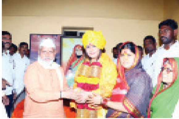
माऊलीचे घेतले दर्शन ; कारेगावच्या संत बाळूमामांच्या सप्ताहात घेतला कीर्तन श्रवणाचा लाभ

भाजपाच्या राष्ट्रीय सचिव तथा महायुतीच्या उमेदवार पंकजाताई मुंडें यांच्या साधेपणाचा प्रत्यय पुन्हा एकदा दिसून आला. श्रीक्षेत्र चाकरवाडीत माऊलीचे दर्शन घेतल्यानंतर त्यांनी स्वतःच्या हाताने महापंगतीतील भाविकांना प्रसाद वाटप केला, त्यांच्या या कृतीने उपस्थित भाविक मात्र भारावून गेल्याचे पहायला मिळाले.