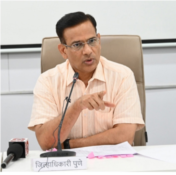
प्रशासनाकडून कार्यवाही केली जाणार आहे. अंतिम मतदारसंख्या त्यावेळी निश्चित होईल.

आजपर्यंत पुणे जिल्ह्यात ४३ लाख २८ हजार ९५४ पुरुष, ३९ लाख ६३ हजार २६९ स्त्री तर ७२८ तृतीयपंथी अशा एकूण ८२ लाख ९२ हजार ९५९ मतदारांची नोंद झाली आहे. नवीन मतदार नोंदणीसाठी अर्ज क्र. ६, आणि स्थलांतरणासाठी अर्ज क्र. ८ सादर करण्याची अद्यापही संधी असून बारामती मतदार संघात ९ एप्रिलपर्यंत तर अन्य तीन मतदार संघात १५ एप्रिलपर्यंत आलेल्या अर्जांवर निवडणूक